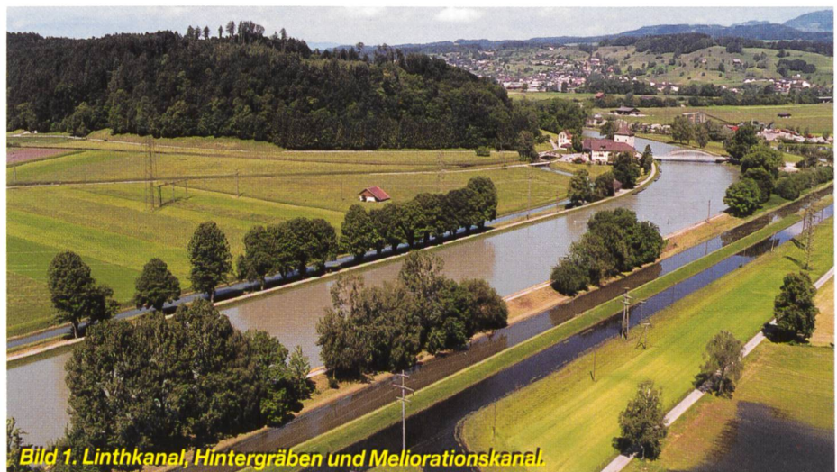
Bild 1. Linthkanal, Hintergraben und Meliorationskanal.