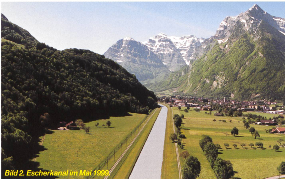
Bild 2. Escherkanal im Mai 1999