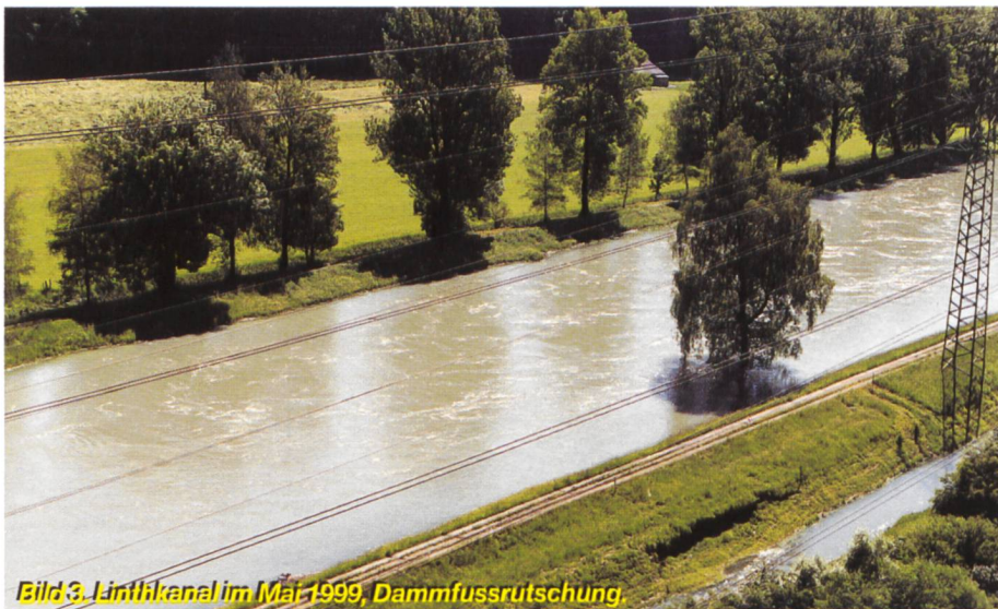
Bild 3. Linthkanal im Mai 1999, Dammfussrutschung

Bis zu diesem Zeitpunkt muss auch die Neuorganisation des Linthwerks abgeschlossen sein.