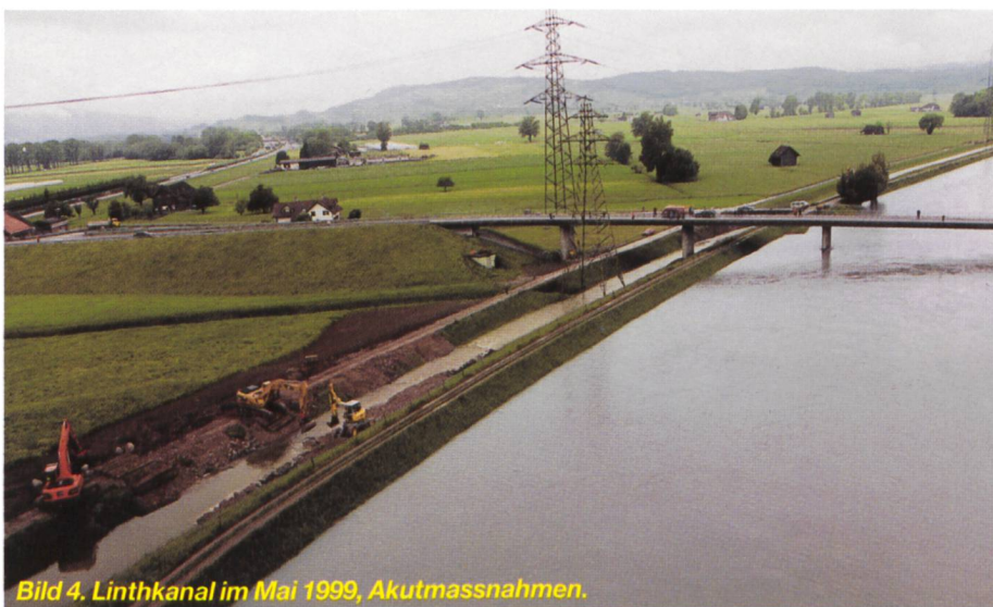
Bild 4. Linthkanal im Mai 1999, Akutmassnahmen.