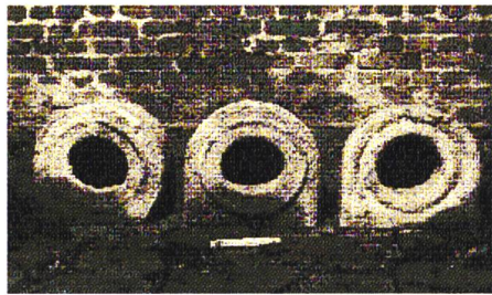
Bild 1. Drei Rohrsteine der römischen Wasserleitung von Bonn.

wurde dieser schwierige Trassenabschnitt aber auch als Druckleitung konzipiert, denn in Bonn wurden grosskalibrige Rohrsteine gefunden. Auch für die Druckleitung wäre ein steinerner Unterbau, der in der Gumme auch auf Bögen geführt werden musste, erforderlich gewesen, so dass der archäologische Befund dem nicht entgegensteht (Bild 1).