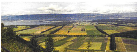
Bild 1. Panorama vom Mont Vully aus: links der Neuenburgersee, rechts der Jolimont, im Hintergrund links der Chaumont und rechts der Chasseral.

Mit der Expo.02 rückte eine schöne, unverwechselbare und interessante Region der Schweiz in den Blickpunkt des Interesses. Die Idee einer Landesausstellung im Grenzgebiet der deutschen und der französischen Sprache in Verbindung mit Wasser, Wasserläufen und Seen ist bestechend. Nebst den kulturellen Aspekten ist die Kulturtechnik in dieser Umgebung nicht minder interessant. Sie ist ein eindrückliches Beispiel für die Thematik der Arbeiten der Fachleute der SIA-Berufsgruppe Boden/Wasser/Luft und soll an dieser Stelle näher betrachtet werden. Wer die Weite der Landesausstellung, des Seelandes und damit der Juragewässer-Korrektion in sein Bewusstsein eindringen lassen möchte, dem sei ein Aufstieg auf den Mont Vully empfohlen, der höchsten Erhebung im Zentrum von Bieler-, Murten- und Neuenburgersee (Bild 1).