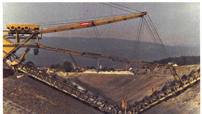
Bild 4. Aushub des Seebodenkanals, Gampelen, Eimerkettenbagger, 1976.