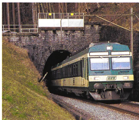
Bild 1. Der Ricken-Bahntunnel verbindet St. Gallen und Rapperswil auf direktem Weg und wird heute auch als Energiequelle genutzt.

Die Realisierung dieses Heizsystems hat zu höheren Wärmegestehungskosten als bei einer konventionellen Gasheizung geführt, da