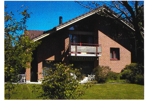
Bild 1. Versuchsobjekt zum Testen der drei Regelstrategien mit Pulsbreitenmodulation.

linie (Tageswärmebedarf in Funktion der Aussentemperatur) oder einer Laufzeitkennlinie (Wärmeleistungsbedarf gemäss Energiekennlinie dividiert durch Wärmeleistungsproduktion gemäss der Wärmepumpenkennlinie). Während die thermische Trägheit des Gebäudes bei der Energiekennlinienmethode unberücksichtigt bleibt, wird sie bei der Laufzeitkennlinienmethode teilweise erfasst. Die wesentlich weiter gehende dritte Strategie (modellbasierte prädiktive Regelung) berücksichtigt die thermische Trägheit von Gebäude und Wärmeverteilsystem durch ein mathematisch-physikalisches Modell. Weiter enthält sie eine Vorausschätzung der zu erwartenden Aussentemperatur für die kom-