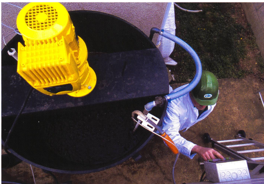
Bild 1. Reduktion von Schlämmen.

Fizit, Französisches Informationszentrum für Industrie und Technik, Frankfurt