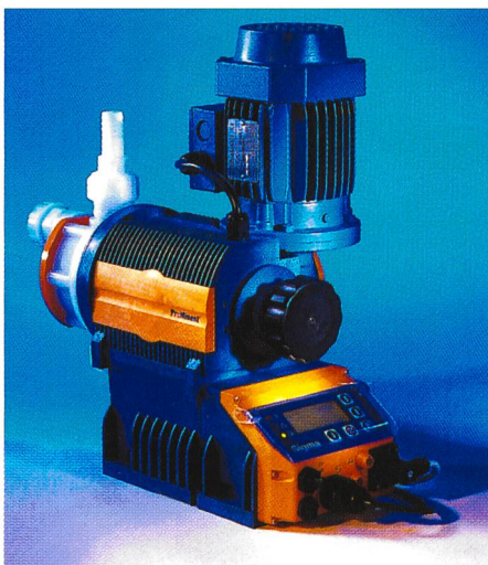
Bild 1. Die neue Sigma/1-Dosierpumpe komplettiert diese Baureihe für den unteren und mittleren Leistungsbereich von 1 l/h bis 1000 l/h bei ProMinent. Ihre Mikroprozessor-Steuerung mit optimaler Kombination aus Drehzahlregelung und Stop-and-go-Betrieb gewährleistet exaktes Dosieren, auch im unteren Minimalbereich.

Diese mechanischen Membran-Dosierpumpen sind mit einer einheitlichen Mikroprozessor-Steuerung