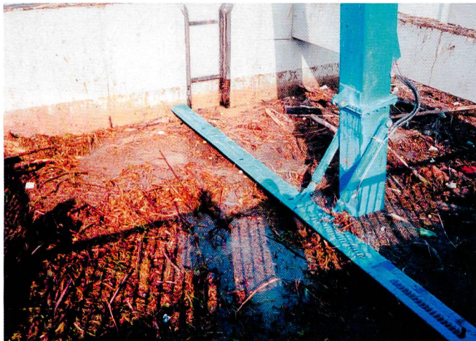
Bild 4. Harke greift vor den Schwemmgutteppich.

Eine Seilrechenreinigungsanlage mit Querförderer hätte dies nie bewältigen können und ein Abstellen der Turbinen wäre unumgänglich gewesen. Mit dem hydraulischen Rechenreiniger aber konnte der Kraftwerks-