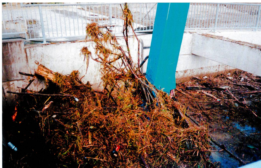
Bild 2. Harke knapp unter der Wasseroberfläche.

Anlage zeigt, dass selbst derart grosse hydraulische Rechenreinigungssysteme bei beengten Platzverhältnissen eingesetzt werden können.