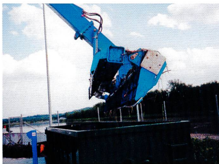
Bild 8. Harke beim Abwurf.

dem Container steht, sich öffnet und das Rechengut in den Container abwirft. Danach dreht sich der Rechenreiniger weiter, bis die andere Hälfte der Harke mittig über dem Container steht und ihr Rechengut abwerfen kann.