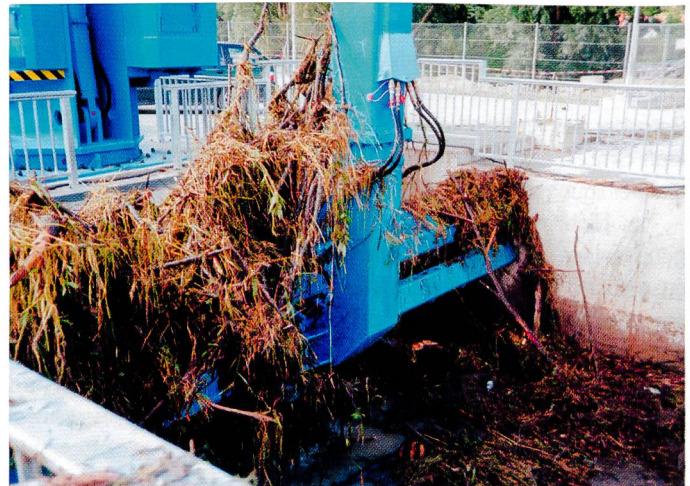
Bild 5. Greiferharke schliesst sich über der Wasseroberfläche.