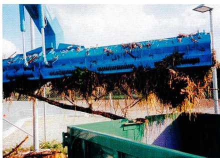
Bild 6. Harke in Abwurfstellung.

Auch die Art des Schwemmgutabwurfes ist in dieser Ausführung einmalig. Da die Greiferharke mit fast 7,5 m um 1 m breiter ist als der Container, ist sie zweiteilig ausgeführt. Der Rechenreiniger dreht sich zuerst so weit, bis die eine Hälfte der Harke mittig über