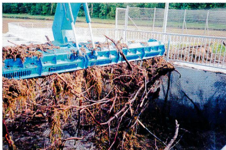
Bild 7. Geschlossene Harke mit Schwemmgut.