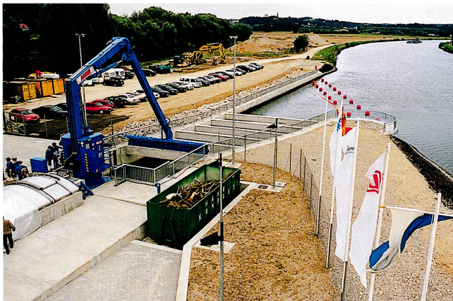
Bild 1. Gesamtansicht Bad Abbach.

Für die Aufstellung der Rechenreinigungsanlage standen weniger als 2,6 m Platz hinter dem Rechen zur Verfügung. Die fertige