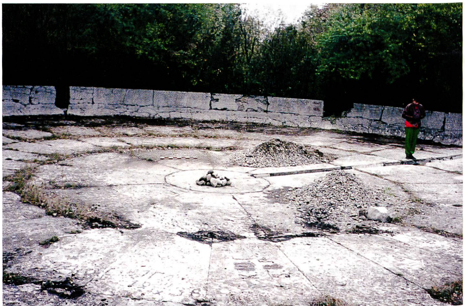
Bild 2. Überreste eines Taubrunnens von F. Zibold in Feodosia (Krim) aus der Zeit um 1900. Durchmesser 20 m, Höhe 8 m.

Nebel wird aus Wassertröpfchen von 1 bis 10 Mikrometern Durchmesser gebildet.