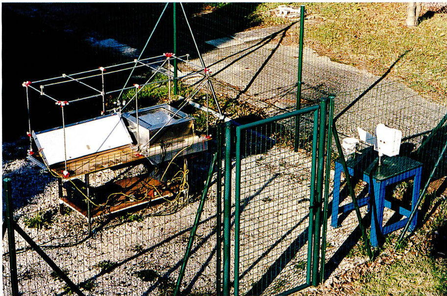
Bild 6. Versuchseinrichtung eines Taukollektors in Grenoble (1997) mit Zusatzausrüstung – Plexiglas, Waage, Manometer usw. – zur Bestimmung der optimalen Ausbeutung und der chemischen Zusammensetzung des Tauwassers.

auf 288 m ü.M. gebaut (Bild 2). Zibold hatte in der Gegend eine grosse Zahl Hügel (Tumuli) und alte Wasserleitungen entdeckt. Er glaubte, es handle sich um Taubrunnen, welche die Stadt mit Wasser versorgten. In den 1990er-Jahren stellte sich jedoch heraus, dass die Tumuli alte Grabstätten sind und dass es in der sonst trockenen Gegend zahlreiche unterirdische Quellen gibt. Nun, Zibold beschrieb 1906 seinen Bau als Wanne mit 20 m Durchmesser und 1,5 m Tiefe, in der Steine von 10 bis 40 cm Durchmesser zu einem 8 m hohen stumpfen Kegel aufgeschichtet wurden. Der Taubrunnen soll bis zu 360 Liter Wasser/Tag geliefert haben. Nach 1912 wurde das Werk vernachlässigt, z.T. abgetragen und verfiel. Deshalb ist es nicht mehr möglich, den Ertrag des Brunnens nachzuprüfen. Der Franzose Léon Chaptal, Direktor des physikalisch-bioklimatischen Institutes in Montpellier, errichtete einen Taubrunnen, 2,5 m hoch und 3 m im Durchmesser. In den heissesten Tagen der Monate April bis September 1930 soll er 100 Liter Wasser/Tag geliefert haben. In den folgenden zwei Jahren ging der Ertrag stark zurück, vielleicht als Folge von Sturmschäden. Von den Berichten Chaptals ermuntert, baute der Belgier Achille Knapen 1930/31 in Trans-en-Provence einen Taubrunnen, der aber im besten Fall täglich nur einen Kübel Wasser lieferte.