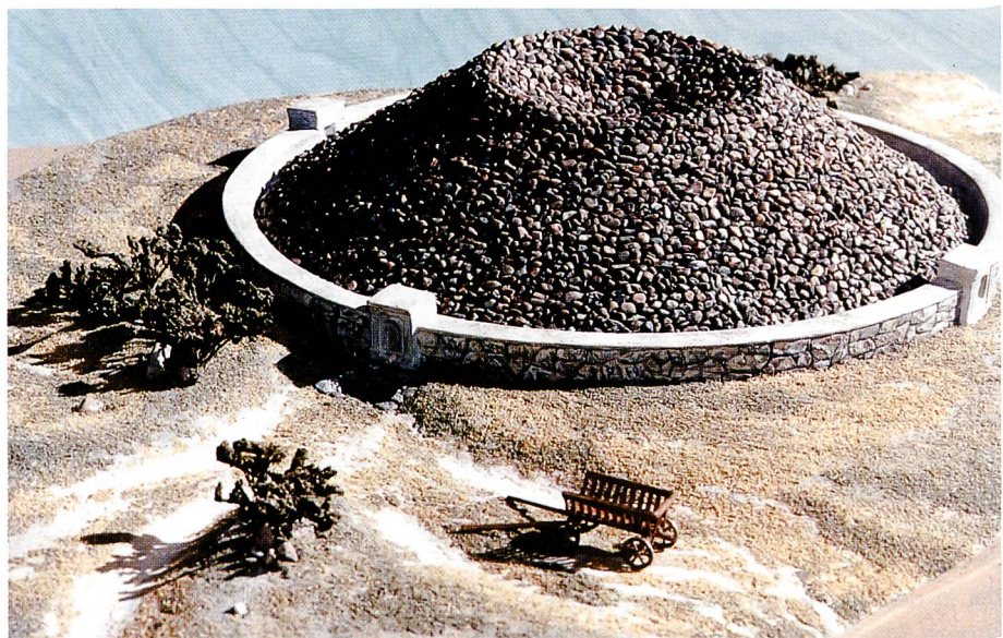
Bild 3. Modell des Taubrunnens von Zibold (1995, OPUR).

Dass sich Nebel an der Vegetation niederschlägt, ist seit Menschengedenken beobachtet und genutzt worden. In vielen Erdteilen, wo Regen selten fällt, aber häufig dichter Nebel vorkommt, schütteln Eingeborene