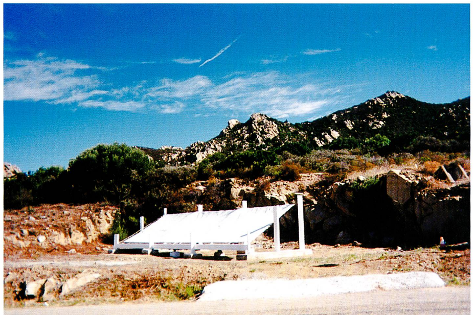
Bild 5. Taukollektor in Vignola, bei Ajaccio, Korsika. Die Kollektorfläche beträgt 30 m 2 , die Ausbeute erreicht bis zu 11,8 Liter Wasser im Tag.

starke Winde, die bis zu 25 km von der Küste die Advektionsnebelbildung auf 500 bis 1000 m ermöglichen.