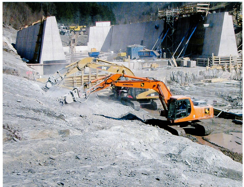
Bild 2. Felsaushub dicht über der Gründungssohle mittels Felsfräsen.