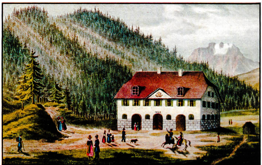
Bild 1. Die Heilquellen von St. Moritz sind die höchsten und ältesten; das 1832 eröffnete Kurhaus bot mehr Komfort und verfügte erstmals über Badezellen

Ab Mitte 18. Jahrhundert kamen Kuraufenthalte in den Bergen in Mode, zuerst im Appenzellerland – ausgehend vom Flecken Gais, damals bekanntestes Dorf der Schweiz – Furore im Kampf gegen die Volksseuche «Schwindsucht» (Lungentuberkulose). Mancherorts, so im Heinrichsbad bei Herisau, kombinierte man die Molke mit dem Kuh-