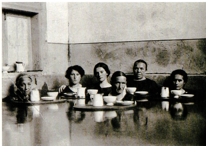
Bild 3. In der Frauenabteilung des Leuker Spitalbads um 1910. Im Armenbad hatten nur Kranke Zutritt, die ein «Armutzeugnis» vorweisen konnten.