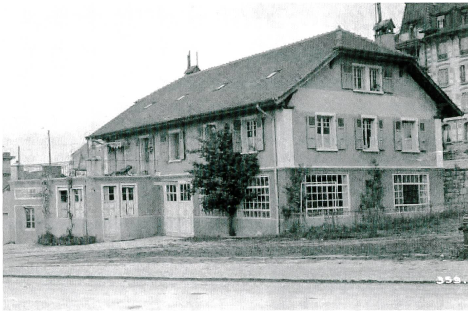
Figure 2. Installation du Laboratoire d'hydraulique à la route de Genève en 1932. Das Wasserbaulaboratorium an der Route de Genève im Jahre 1932.

L'Ecole délivre désormais des diplômes d'ingénieur civil, mécanicien, chimiste et électricien.