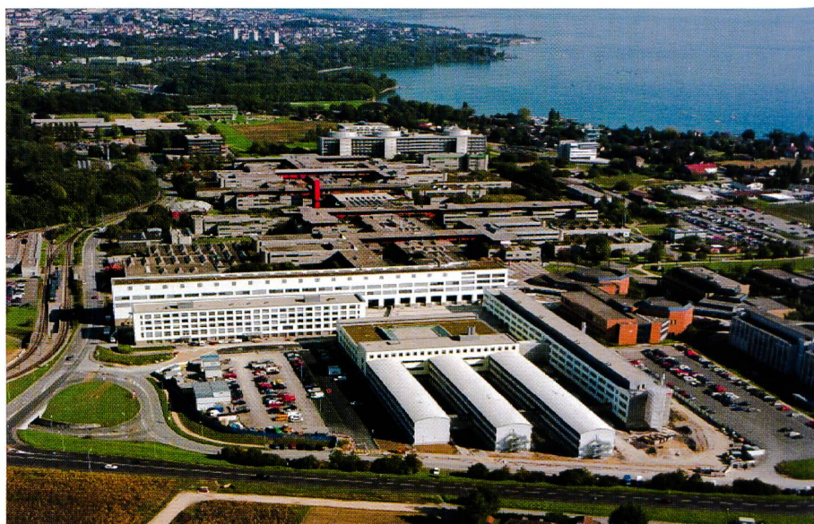
Figure 5. Vue aérienne de l'EPFL, début 2003. Luftaufnahme der EPFL Anfang 2003.