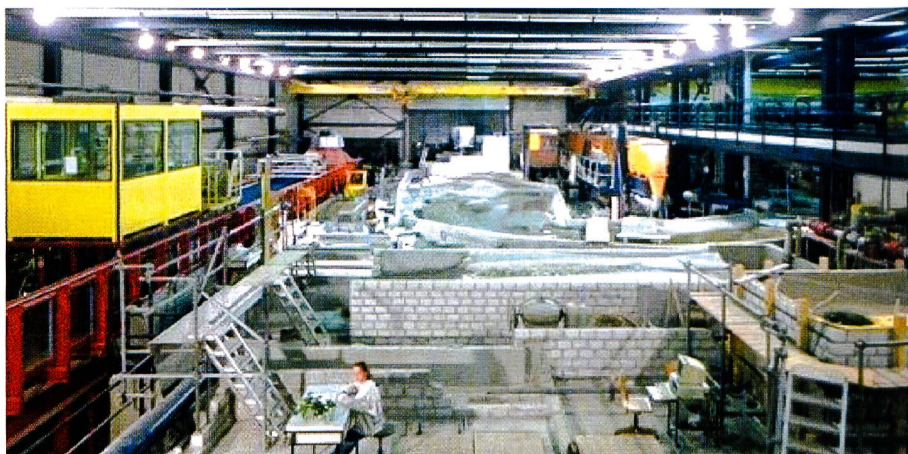
Figure 4. La halle d'essais du laboratoire sur le site de l'EPFL à Ecublens, depuis 1979. Seit 1979 befindet sich die hydraulische Versuchshalle auf dem Gelände der EPFL in Ecublens.

Jean-Louis Boillat, Laboratoire de constructions hydrauliques, Ecole Polytechnique Fédérale de Lausanne, CH-1015 Lausanne.