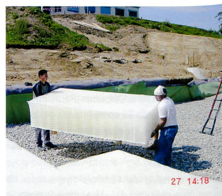
Bild 2. Hauptkomponente des neuen Speichersystems sind die leichten, wabenförmigen und druckstabilen Nidaplast-Polyethylen-Kunststoffblöcke. 95% des Blockvolumens sind mit Wasser füllbar.