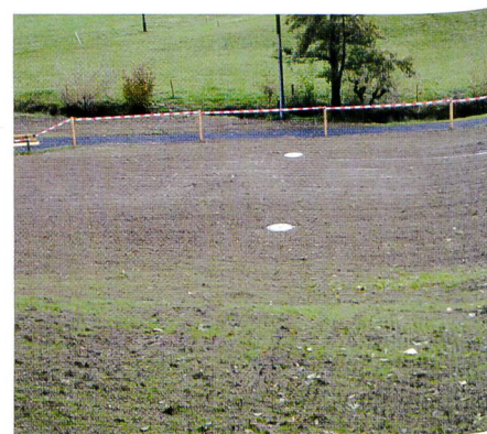
Bild 3. Für den Beckenbau benötigtes Land bleibt als Kulturland nutzbar.