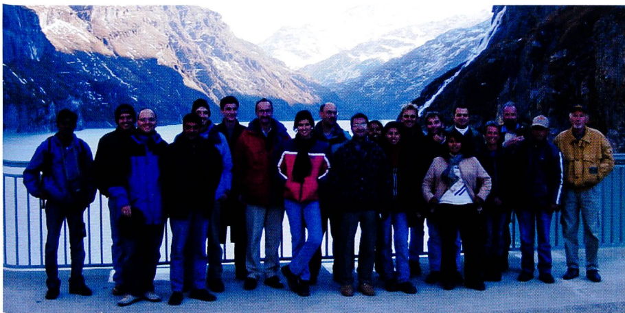
Première excursion dans le cadre du module 1.7 Energie hydraulique, approche globale et stratégie.