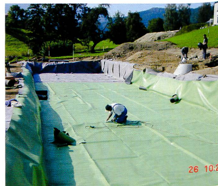
Bild 1. Kostengünstige Regenwasserspeicherung in einem unterirdisch angelegten Retentionsbecken: Mit dem neuen Nidaplast-Sarnafil-System ist beliebiges Retentionsvolumen relativ einfach herstellbar. Abgedichtet werden die Becken mit Sarnafil-Kunststoffbahnen.

Ernst Küng GmbH, Gas-, Wasser- und Abwassertechnik, Krämermatt 3, CH-6330 Cham, Tel. 041 783 05 75, Fax 041 783 05 77, www.ernstkueng.ch