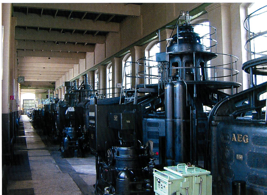
Bild 2. Blick in den Maschinensaal des Kraftwerks Rheinfelden.

Das Projekt 1989 war getragen vom politischen Willen auf beiden Seiten des