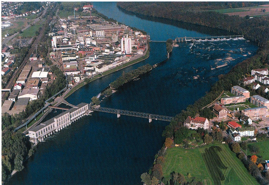
Bild 1. Luftbild des heutigen Kraftwerks Rheinfelden.