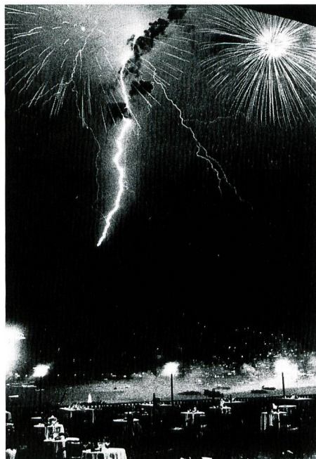
Bild 1. Dieses märchenhafte Bild wurde während eines Seenachtsfests im Tessin aufgenommen, als zugleich ein Blitzschlag die pyrotechnischen «Kugelblitze» durchzuckte. Mit solch einer Foto, die selbst in Büchern als «Kugelblitz»-Beweis veröffentlicht wurde, hatten seinerzeit die Studenten Professor Jensen genarrt.

Es wird erzählt, dass «Kugelblitze» gelegentlich sogar durch Fensterscheiben, Schornsteine und Schlüsselöcher schlüpfen oder durch Zimmer und Ganzmetallflugzeuge