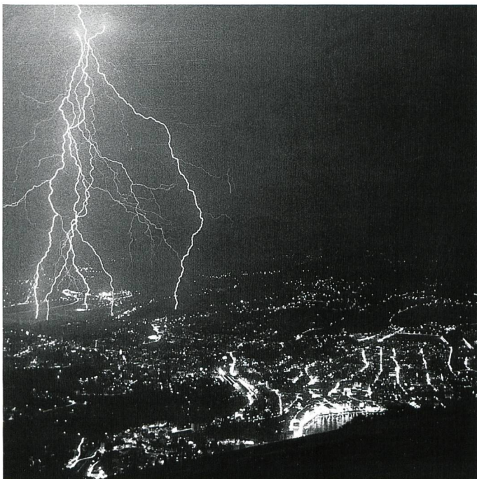
Bild 5. Eine Garbe von Abwärtsblitzen (mit nach unten verzweigten Verästelungen), eintauchend ins Weichbild von Lugano (Bild: FKH).

Blitzzunfälle sind nicht immer tödlich. Wenn ein Teil eines Blitzstroms über den menschlichen Körper fliesst, kann dies zu unwillkürlichen Muskelreaktionen führen, die einen Menschen mehrere Meter fortschleudern können; daher sind auch Stellen mit Absturzgefahr zu meiden. Ganz allgemein hält man sich am besten an die von der Blitzschutzkommission des Schweizerischen