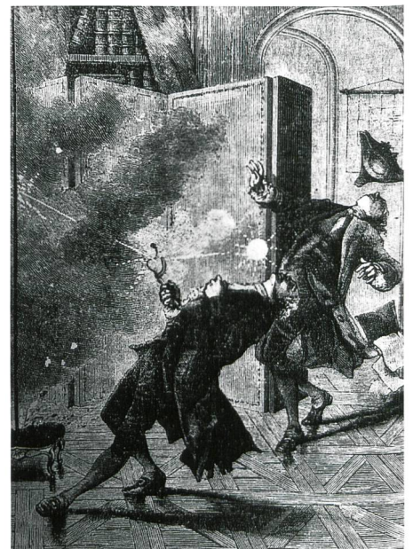
Bild 3. Tödlicher Unfall durch Blitzschlag von Professor G. W. Richmann in Petersburg im Jahre 1753, als er während eines Gewitters experimentierte.