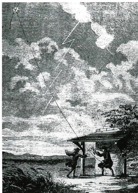
Bild 2. Das berühmt gewordene Drachenexperiment, mit welchem es Benjamin Franklin 1752 in Philadelphia erstmals gelang, Elektrizität in der Atmosphäre nachzuweisen.