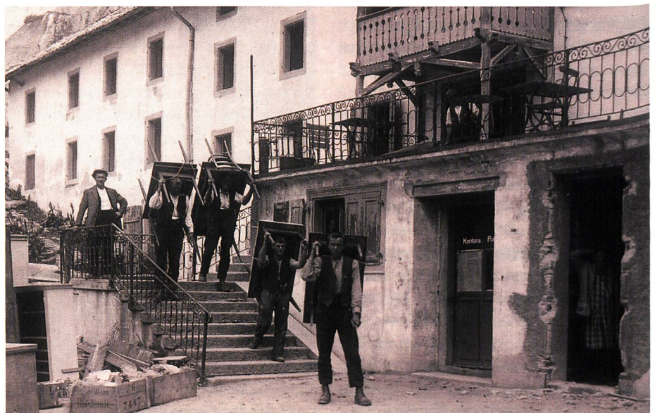
Bild 4. Das alte Grimsel-Hospiz wird geleert, bevor es niedergebrannt wird. 1929.