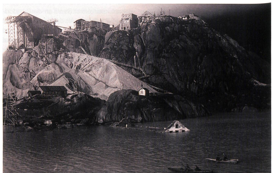
Bild 5. Das alte Grimsel-Hospiz versinkt im Stausee, während auf dem Nollen die Bauarbeiten weitergehen. 5. September 1930.