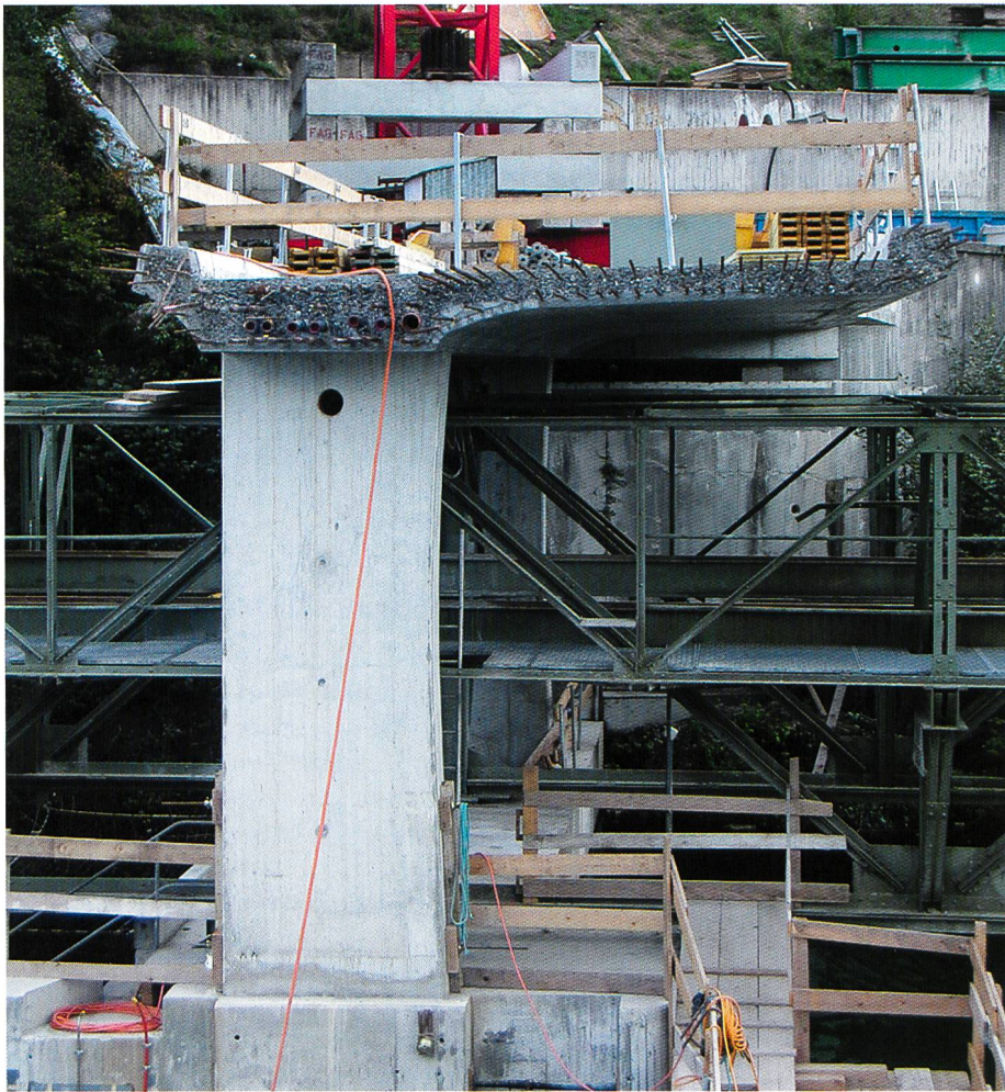
Bild 7. Fertiger Brückenquerschnitt über dem Schiffsaufzug.

Erneuerung des Wehres ist ein weiterer Schritt zur Vollautomatisierung des Kraftwerkbetriebes.