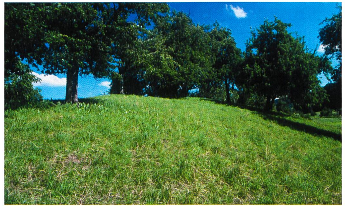
Bilder 2 und 3. Die Farbe der Landschaft zeigt sichtbar den Wassergehalt. Der Trockensommer 2003 hinterliess sehr deutliche Spuren in der Landschaft. Die Wiesen waren braun und trocken, wie in der Savanne, die Bäume noch grün. Ein Jahr später hat die Wiese wieder ihr normales Grün (Standort: Hallwil AG).