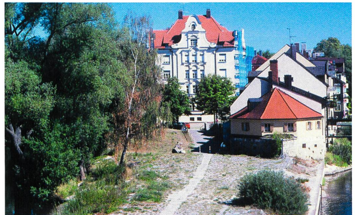
Bilder 5 und 6. Das Bildpaar zeigt Regensburg zur Zeit des höchsten Wasserstandes (15. August 2002) und schliesslich im Herbst 2003, nach dem Jahrhundert-Trockensommer.