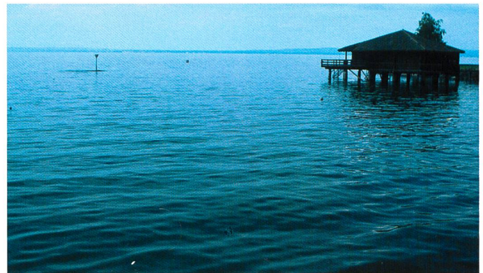
Bilder 7 und 8. Vor einem Jahr lag dieses Boot am Bodensee auf dem Trockenen, während in diesem Sommer der Wasserstand wieder deutlich höher ist (Standort: Staad SG).

dem herrschte Ende Juni an vielen Orten Waldbrandgefahr. Auch zum Teil an Orten, wo dies eher selten ist. So mussten im Kanton Solothurn die Feuerwehren gleich zu mehreren Waldbränden ausrücken.