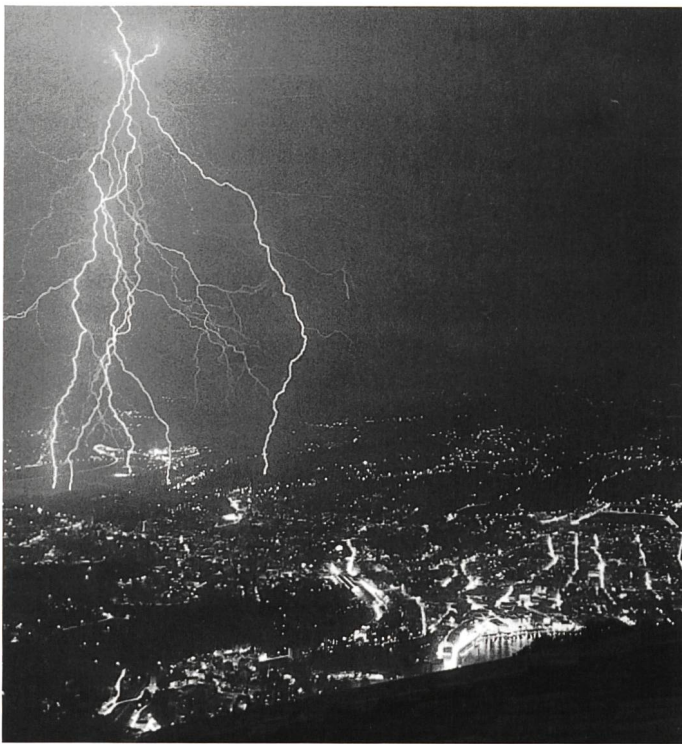
Bild 4. Eine Garbe von Abwärtsblitzen (mit nach unten verzweigten Verästelungen), eintauchend ins Weichbild von Lugano.