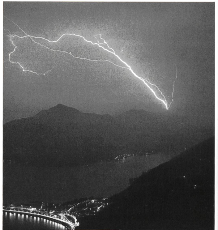
Bild 5. Typischer Aufwärtsblitz, nach oben verzweigt, aufgenommen vom San Salvatore aus; im Vordergrund der Damm von Melide.

mit seiner langen Knete. Ferner bot sich hier eine ausgezeichnete 360°-Rundsicht für fotografische Rundum-Untersuchungen, und schliesslich erleichterte die vorhandene Seilbahn den Antransport der technischen Einrichtungen.