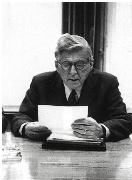
Bild 1. Der Begründer und Promotor der Schweizer Blitzforschung, der 1993 verstorbene ETH-Professor Karl Berger, liebevoll «Vater des Blitzes» genannt.

1926 hatte er mit Messungen von Blitzüberspannungen auf grossen elektri-