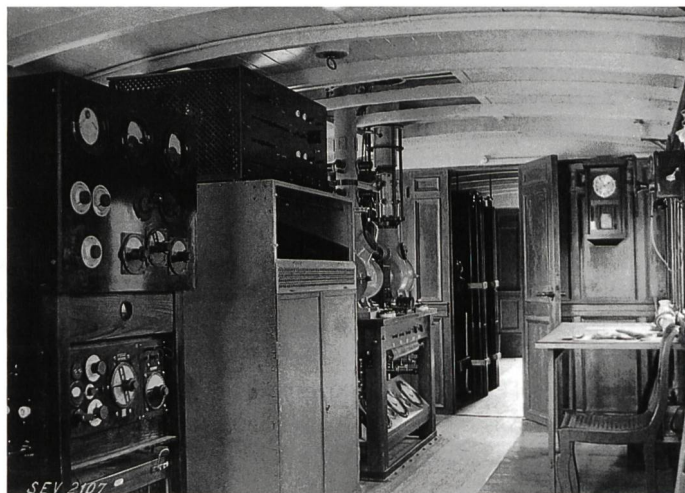
Bild 3. Die Apparaturen des mobilen Labors waren ebenfalls in einem ausrangierten SBB-Wagen untergebracht.