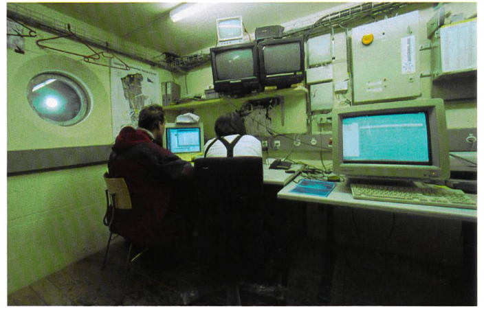
Bild 4. Im Innern des Bunkers arbeiten die Wissenschaftler und überwachen die Messung während des Lawinnenniederganges.

mer als Staublawinen, räumen jedoch durch ihr grosses Gewicht (nasser Schneel) alles zur Seite und begraben es unter ihrer tonnen-schweren Last. Eine solche Lawine kann zum Beispiel einen Druck von 50 Tonnen pro Quadratmeter erzeugen. Bei den Schneebrettlawinen bricht die Schneedecke wie eine Scholle ab und beginnt ins Tal zu rutschen. Oft werden solche Lawinen von Skifahrern ausgelöst.