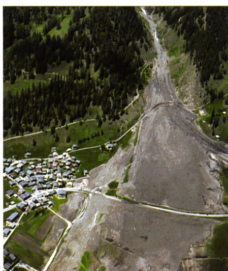
Bild 5. Die Luftaufnahme zeigt Geschinen im Goms VS. Ein riesiger Schuttkegel – die Reste einer Lawine, die das Dorf streifte – prägt auch im darauffolgenden Sommer noch das Landschaftsbild.