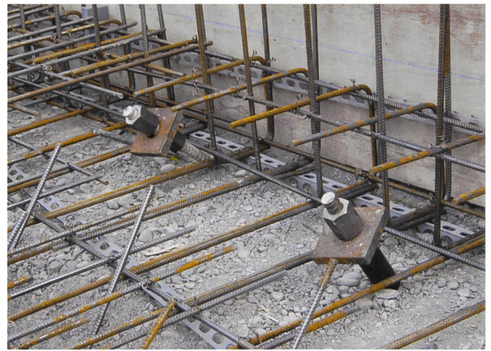
Bild 3. Teilweise fertig bewehrte Gehwegplatte mit bergseitigen, geneigten Mikropfählen. Die Kopfplatte wird aus Kraftschlussgründen einbetoniert.

folgte aber auch die Entkräftung der Vermutungen, dass die Instabilität entweder von einem Erosionsprozess vom Reussgewässer aus gehe oder dass es sich um eine Instabilität des gesamten Steilhanges unterhalb der Stadthäuser handle.