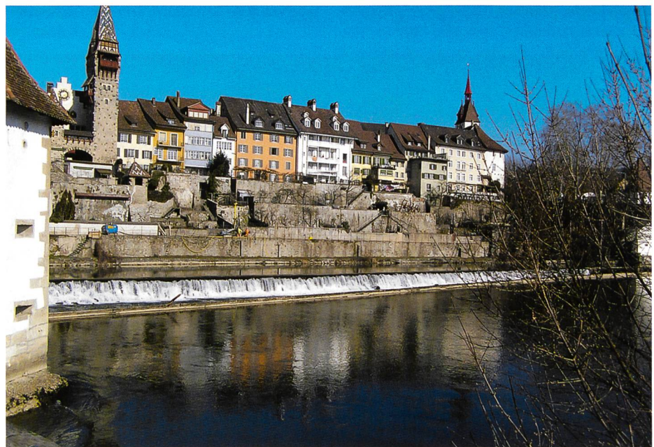
Bild 1. Blick auf die Altstadt Bremgarten mit der Reuss im Vordergrund.

Beobachtungsmessungen mit Präzisionsinstrumenten während zwei Jahren bestätigten die Vermutung, dass die reussnahen Mauern teilweise instabil sind. Es wurden Bewegungen in Richtung Reuss bis zu 6 mm gemessen. Daraufhin wurden Rammsondierungen im Erdreich und Sondierbohrungen in der Mauerkonstruktion angeordnet. Mit den Erkenntnissen aus diesen Untersuchungen konnte in einer erarbeiteten Zustandsbeurteilung die Stadt Bremgarten, als Eigentümerin des Weges und somit Auftraggeberin für die Ingenieurleistungen, über die noch vorhandenen Sicherheiten der Stützbauwerke und die Gebrauchstauglichkeit des Reussuferweges informiert werden.