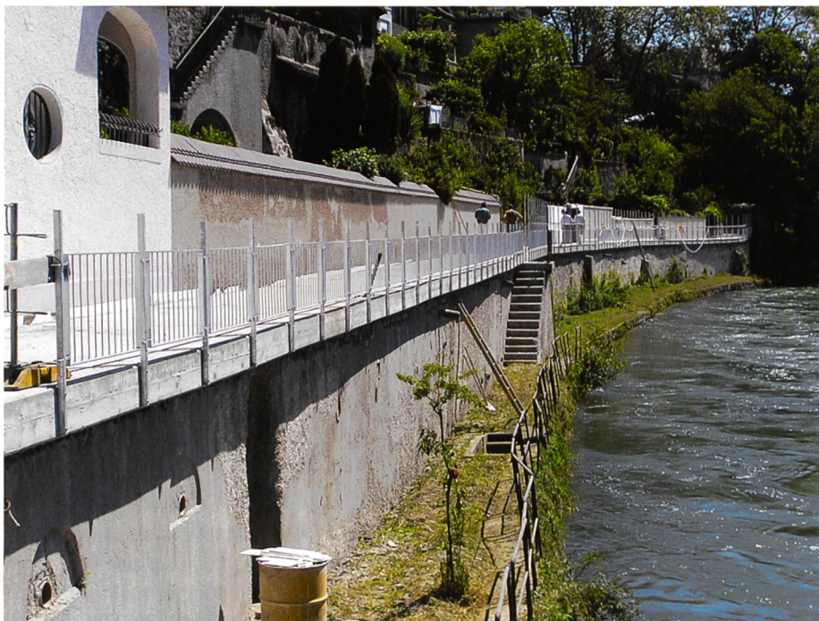
Bild 4. Fertig gestellter und wieder sicherer Reussuferweg.

Diesen Sommer werden sie bereits wieder blühen und mit ihrem Duft die Gemüter erfreuen: die Rosen am sanierten Reussuferweg in Bremgarten.