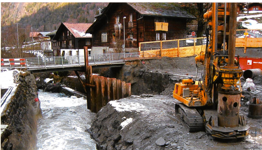
Bild 1. Vorgebohrte Spundwände als Baugrubenabschluss.