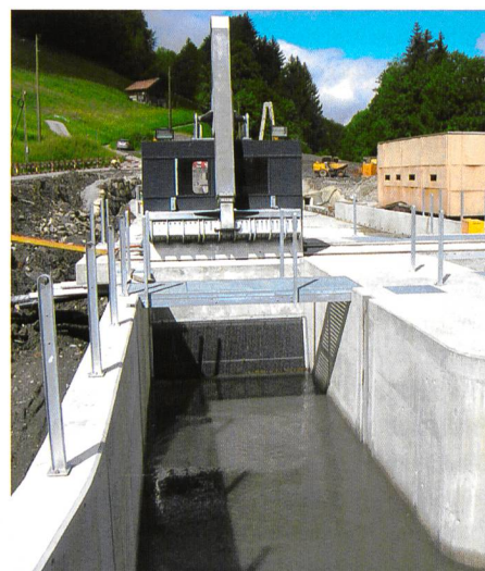
Bild 2. Entsander-Einlauf mit Feinrechen und Rechenreinigungsmaschine.