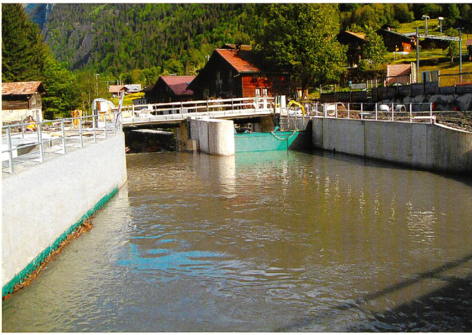
Bild 3. Neue Wehranlage von der OW-Seite; links ist der Grobrechen sichtbar.