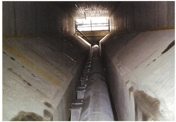
Bild 4. Sandabzugrohre mit Einlaufkästen.

und in einer Mulde zur Entsorgung bereitgestellt.