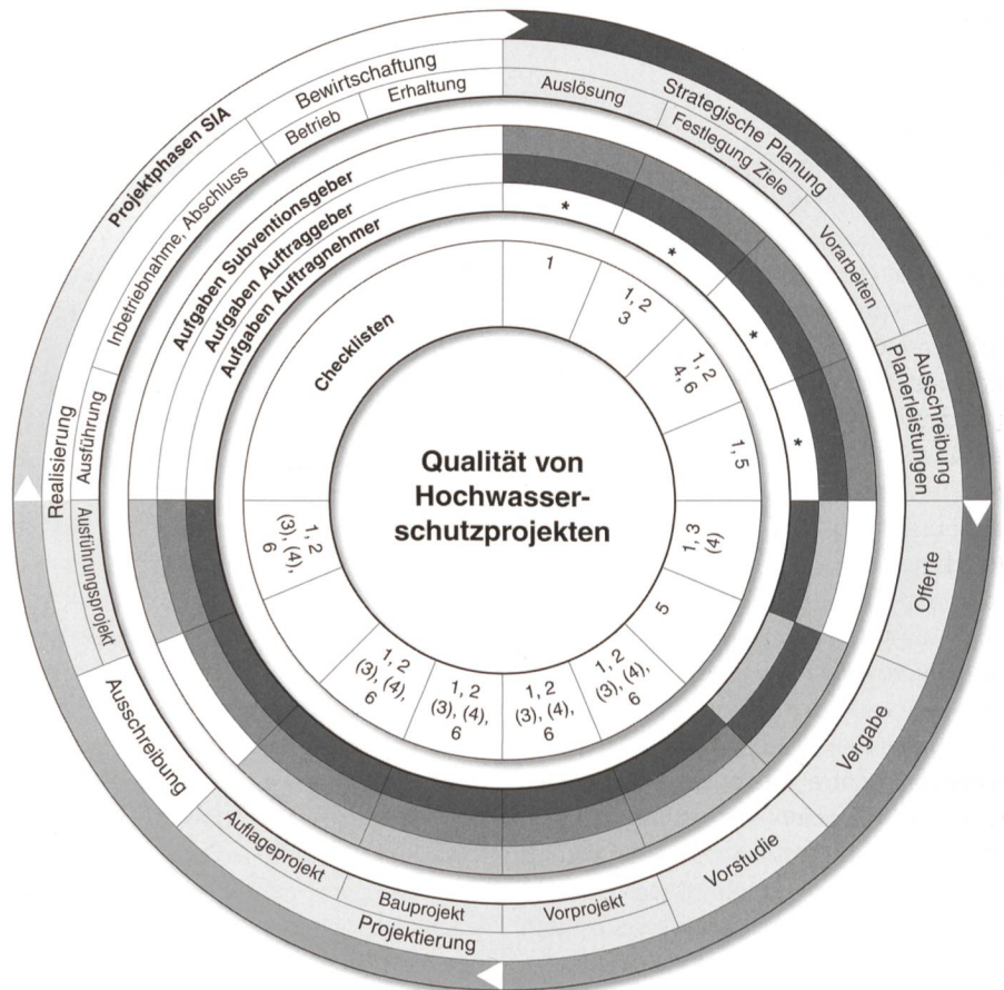
Bild 1. Übersicht Projektphasen, Aufgaben der Akteure und Checklisten.

Die Aufgaben der Akteure (Subventionsgeber, Auftraggeber und Auftragnehmer) sind entsprechend den grau unterlegten Feldern in den drei Ebenen des