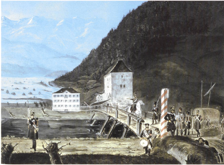
Bild 3. Die 1833 von eidgenössischen Truppen besetzte Brücke über den Linthkanal in Grinau; im Hintergrund die überschwemmte Linthebene bei Tuggen. Gemälde von Unbekannt.

Hatten die Seitenbäche die Wiesen überschwemmt? Oder stauten ein hoch stehender Zürichsee und ein hochgehender Linthkanal diese Niederungen über die Hintergräben ein, so wie es nach Legler einst mehrfach vorkam (Legler, 1868)? Das Ereignis lässt sich relativ genau datieren, das heisst auf den August 1833, weil es zu einer kritischen Episode der Schwyzer Geschichte gehört: In der Restaurationszeit wollte der Hauptort Schwyz mit den inneren Bezirken zusammen die äusseren Bezirke, einschliesslich Küssnacht am Rigi, wieder zu Untertanenland machen. Die äusseren Bezirke liessen sich das aber nicht gefallen und konstituierten sich 1832 zu einem neuen «Kanton Schwyz, äusseres Land». Darauf reagierten die inneren Bezirke am 31. Juli 1833 mit der militärischen Besetzung von Küssnacht, was die Eidgenossenschaft auf den Plan rief. Diese belegte den ganzen Kanton unverzüglich mit einem starken Truppenkontingent – und damit auch das Schloss Grinau als wichtige Grenz- und Zollstelle bei der Linthbrücke. Entschlossen erzwang sie so die Wiedervereinigung aller Bezirke zum heutigen Kanton Schwyz (Michel, 1987).