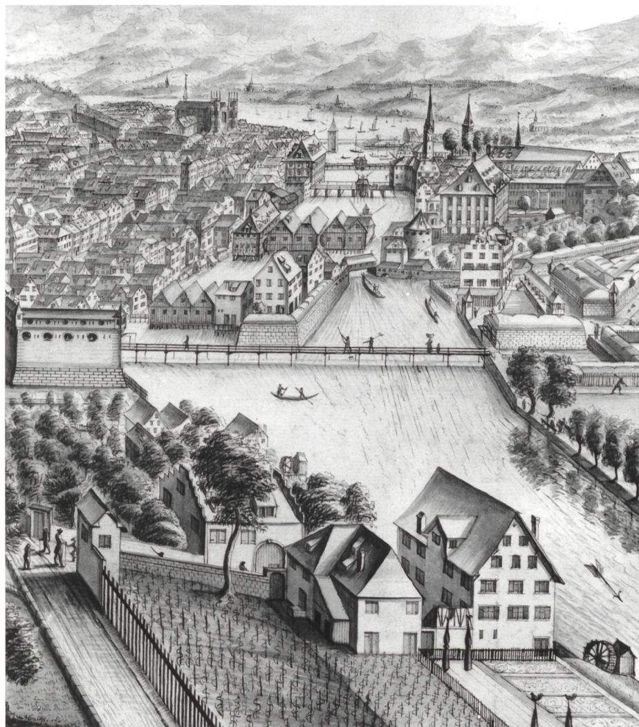
Bild 2. Die Limmat in Zürich flussaufwärts gesehen. Ausschnitt aus einer Zeichnung von Jacob Hofmann 1772 (Baugeschichtliches Archiv der Stadt Zürich).

Noch gab es aber zwei bedeutende Hindernisse im Seeausfluss, nämlich die beiden Mühlestege, die immer noch eng mit Mühlen und anderen Bauten besetzt waren. In diesen versuchte man deshalb