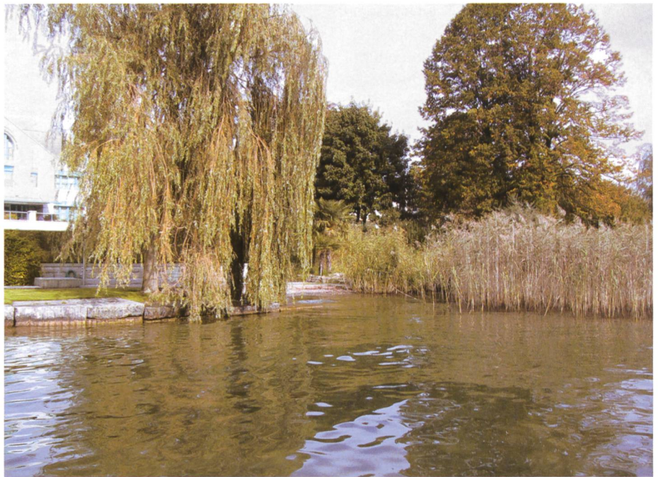
Bild 2. Ufergestaltung bei Privatgrundstück.