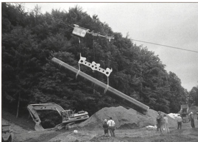
Transport und Versetzen Erdgasleitung, Rohrgewicht 12 Tonnen