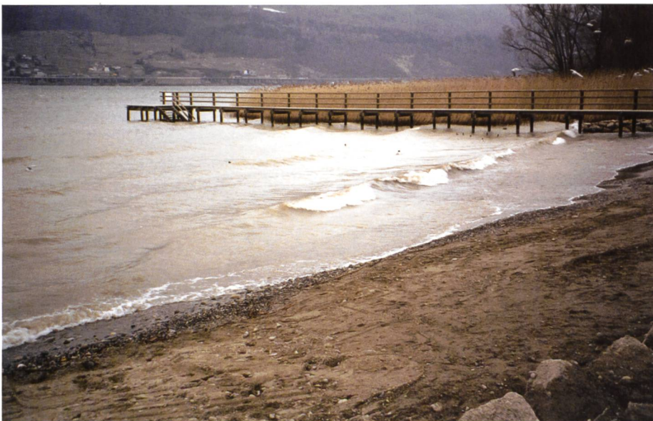
Bild 4. Je seichter die Flachwasserzone und je geringer die Schüttneigung, desto feineres Material kann geschüttet werden.

Am Bielersee bestehen Erfahrungen mit verschiedenen Kiesqualitäten. Gewaschenes und fraktioniertes Material