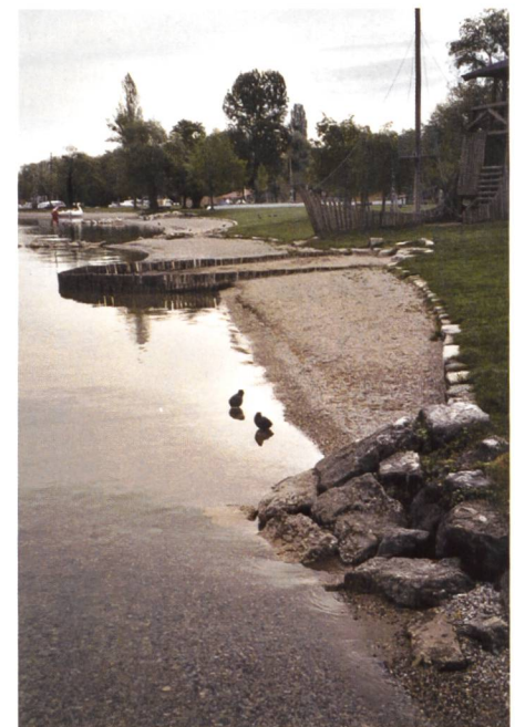
Bild 5. Die Verjüngung der Böschungsbreite gegen den Vordergrund hin hat eine übersteile Böschungsneigung. zur Folge. Die Kiesschüttung wird durch die Brandung jedoch abgeflacht, was zu einem Verlust von Material durch seitliche Verfrachtung in Richtung des Betrachters oder zu einer Unterspülung der Blockreihe an der Böschungsoberkante führt.