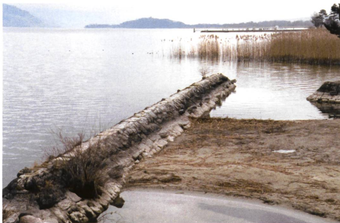
Bild 2. Durch Diffraktion der Wellen am Wellenbrecher (links) bildet sich ein Tombolo (rechts).