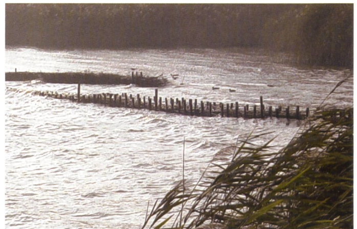
Bild 3. Wellendämpfende Wirkung von Lahnungen.

an diesem Abschnitt jedoch sämtliche Projektziele verfehlt: Eine natürliche Uferdynamik wurde unterbunden und eine Aufwertung des seeseitigen Uferbereichs und die Ansiedlung von Schilf wurde so verhindert. Gleichzeitig muss anhand der nun häufig zu beobachtenden «wildem» Feuerstellen darauf geschlossen werden, dass der Kiesstrand ein beliebter Aufenthaltsort für Erholungssuchende geworden ist. Nicht zuletzt hatte die Kiesschüttung auch einen erheblichen Mehraufwand zur Folge.