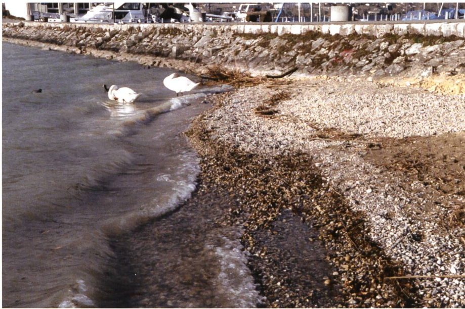
Bild 6. Eine Mole bildet den seitlichen Abschluss der Kiesschüttung. Die Wellen werden der Mole entlang jedoch beschleunigt und treffen mit erhöhter Energie auf den Kieskörper auf. Bereits kurz nach dem Einbau ist hier eine Materialverlagerung entlang des Dammfusses festzustellen. Dies führte in der Folge zu einer übersteilen Böschungsneigung, weshalb die Stelle nachträglich mit einer Pflasterung aus Blöcken gesichert werden musste.

ist wenig stabil. Mangels innerer Kohäsion wird der Kieskörper durch die Brandung zu stark verformt (Beispiel: westlich des Hafens Ipsach, Baujahr 1996). Kies aus Flüssen oder Deltas eignet sich im Allgemeinen sehr gut. Beispiele finden sich in den beiden Erosee-Versuchsstandorten Lüscherz mit Kies aus dem Schüssdelta bei Biel (1996) und Ipsach Erlenwäldli mit Kies aus der Aare in Bern (2001). Kies ab Wand kann gegenüber dem Flusskies den Nachteil eines zu hohen Feinanteils haben, was einen Materialverlust durch Auswaschung von bis zu 30% des eingebrachten Volumens zur Folge haben kann (Beispiel Strandbad Erlach 1998, vgl. Bild 5). Andererseits ist damit der Vorteil verbunden, dass so viel Feinmaterial zurückbleibt, wie es der Standort erlaubt. Ein Beispiel ist der Strandplatz in Sutz (2005, vgl. Bild 4), an welchem die Wellenbelastung infolge der seichten Flachwasserzone geringer ist als angenommen, was zu einem sehr feinkörnigen und dadurch idealen Badestrand führte. Ein nach einer bekannten Siebkurve künstlich zusammengemischtes Material wurde bei einer Privatparzelle auf der St. Petersinsel eingesetzt (2004). Als Vorlage diente die Siebkurve des Versuchstandortes Lüscherz. Der leicht höhere Materialpreis pro Volumeneinheit konnte kompensiert werden, indem auf die Schüttung von zusätzlichem Reservematerial verzichtet und dadurch auch höhere Transportkosten vermieden werden konnten.