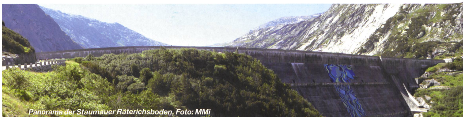
Panorama der Staumauer Räterichsboden