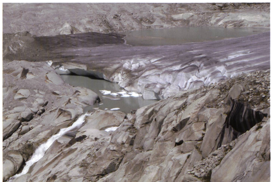
Vor einem Granitblock teilt sich das Wasser in zwei tosende Bäche über eine zerklüftete Felswand in die Ebene von Gletsch.

Seit 2005 überspannt eine spektakuläre Hängeseilbrücke die Schlucht beim Ausfluss des Triftsees. Und die Kraftwerke Oberhasli (KWO) befördern mit einer Werkbahn Berggänger in die Nähe des jüngsten Berner Gewässers. Gemäss KWO-Sprecher Ernst Baumberger ist die Frequenz der Gondelbahn seither «von null auf 25 000 bis 30 000 Personen pro Jahr gestiegen». Einen vergleichbaren Effekt dürfte der Rottensee aber kaum auslösen. Denn der Rhonegletscher wird bereits seit mehr als 160 Jahren touristisch genutzt. ■