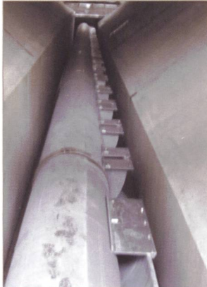
Neuanlage, Burglauenen (JB)

für Entsanderanlagen System HSR: Engineering, patentierte Abzüge, Spühlschieber, Sedimentmessungen, Beruhigungsrechen