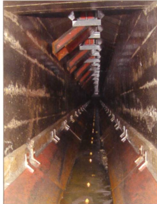
Umbaulösung WF Tantermozza (EKW)