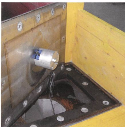
Bild 3a. Aufnahme des Geophonsensors, montiert unter einer Stahlplatte (Foto WSL).