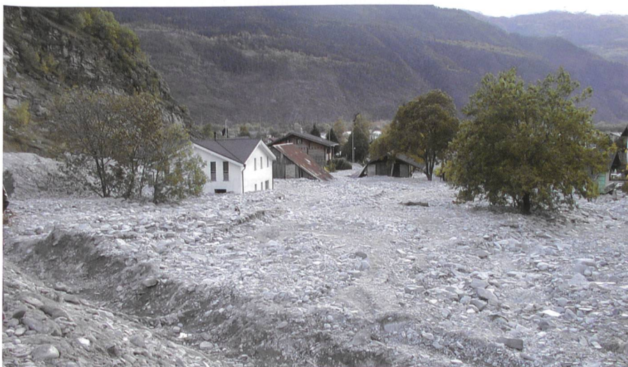
Bild 2. Während des Hochwasserereignisses vom 15. Oktober 2000 in Baltschieder (Kt. Wallis) wurde der gesamte Dorfbereich zum Teil meterhoch mit Geschiebe bedeckt. Blick von oberhalb des Dorfes ins Tal.