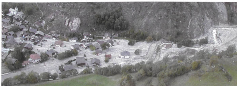
Bild 1. Luftbild des oberen Teils der Gemeinde Baltschieder (Kt. Wallis) nach dem Hochwasserereignis am 15. Oktober 2000. Das eingetragene Geschiebe hat sich im gesamten Dorfgebiet abgelagert.

In diesem Artikel stellen wir eine indirekte Methode zur Geschiebemessung vor, die von der Eidgenössischen Forschungsanstalt für Wald, Schnee und Landschaft (WSL) entwickelt worden ist und seit mehr als zwanzig Jahren erfolgreich eingesetzt wird. Nachfolgend diskutieren wir Einsatzmöglichkeiten und