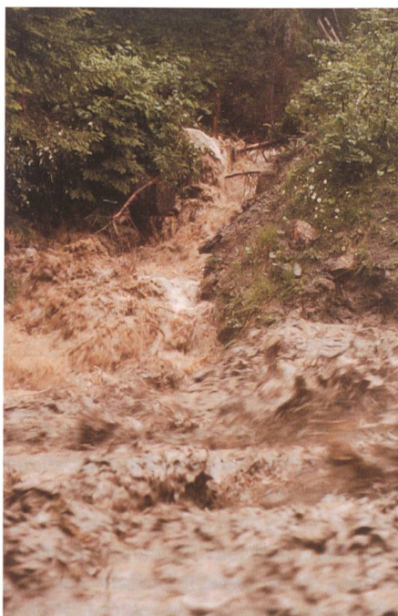
Bild 4. Der Erlenbach im Alptal, Kt. Schwyz, während des Hochwasserereignisses am 14. Juni 1995.

Die WSL betreibt ein hydrologisches Versuchsgebiet im Alptal im Kanton Schwyz, einem voralpinen Gebiet nahe Einsiedeln (Hegg et al., 2006). Im Erlenbach wird seit 1978 der Abfluss an einer hydrologischen Station regelmässig gemessen. Im Jahr 1982 wurde unterhalb der Messstation ein Geschieberückhaltebecken gebaut, um die Gesamtmengen des transportierten Geschiebes zu erfassen. Zur genaueren Messung des Geschiebetransportes vor allem während Hochwasserereignissen wurden 1986 PBI-Sensoren oberhalb des Geschiebesammlers in Betrieb genommen (Bänziger und Burch, 1990, 1991). Zusätzlich waren seit 1995 PBI-Sensoren an