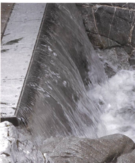
Bild 3b. Geophonsystem im Einsatz im Vogelbach (Alptal, Kt. Schwyz); die Stahlkonstruktion ist an der Unterwasserseite einer Wildbachsperre montiert. Die Stahlplatten haben Abmessungen von 36x50 cm.

in Forschung, Ereigniswarnung und Intervention und in Geschiebehaushaltsstudien. Standortvoraussetzungen werden kurz skizziert und sind in Tabelle 1 zusammengefasst. Grundsätzlich sind halbqualitative Informationen zum Geschiebetrieb in einzelnen Bächen auch für die Ereignisdokumentation und Gefahrenbeurteilung von Nutzen.