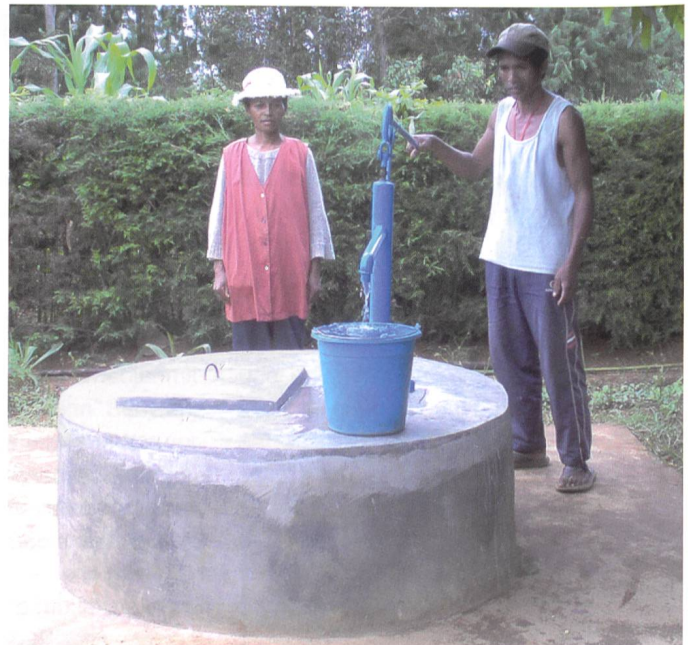
Bild 2 rechts. Brunnen mit einer pompe à Ramah, Copyright DIC Madagascar.

finanzieren möchte. Beispielsweise finanzieren in diesem Jahr Gommiswald und Frauenfeld dasselbe Projekt von Swissaid in Guinea-Bissau mit, welches dank dieser Hilfe umgesetzt werden kann. Weiter unterstützten die Wasserversorgung Herisau und die Wasserversorgung «Gemeindeverband Blattenheid» ein Projekt der Helvetas in Moçambique.