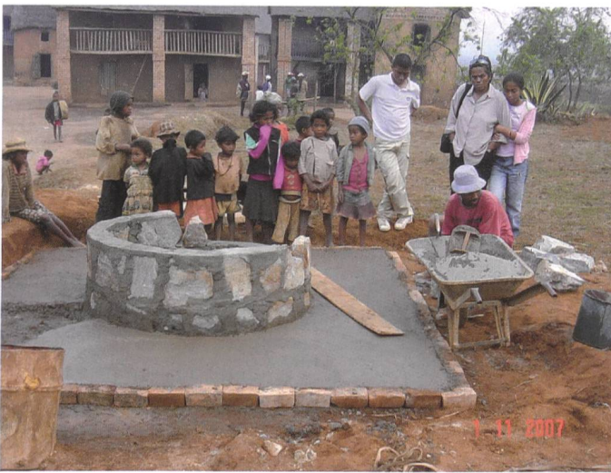
Bild 1 oben. Der erste gebaute Brunnen in Ihazolava, Copyright DIC Madagascar.