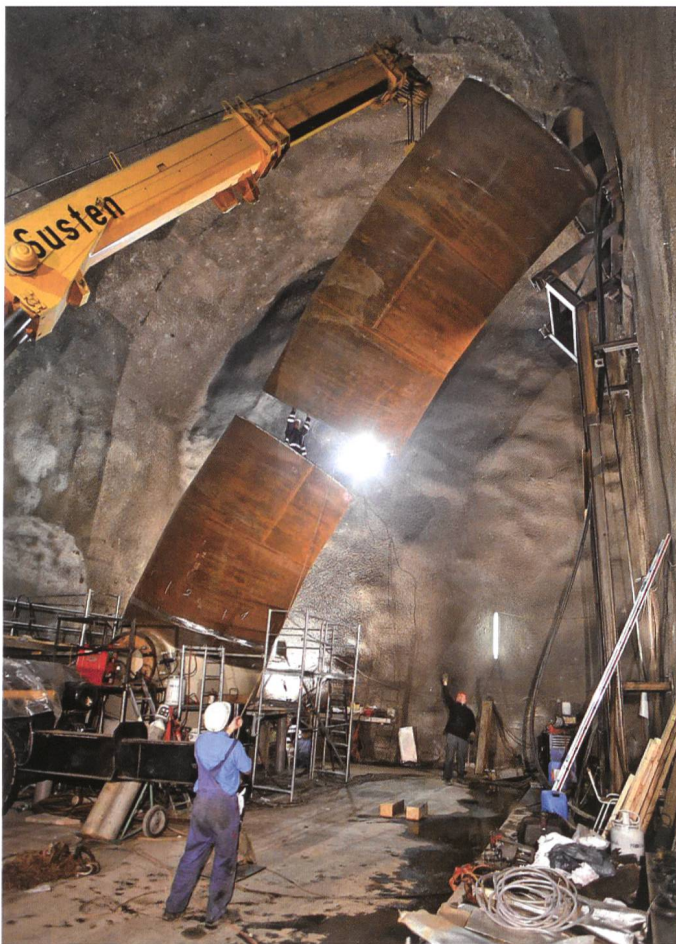
Figure 2. Montage du coude Fol.

Le chantier est divisé en quatre lots: FI à FIV (de haut en bas), délimités par les fenêtres de Tracouet, Dzerdjonna, Péroua, Condémines et Bieudron. Le lot FIII inclut le by-pass.