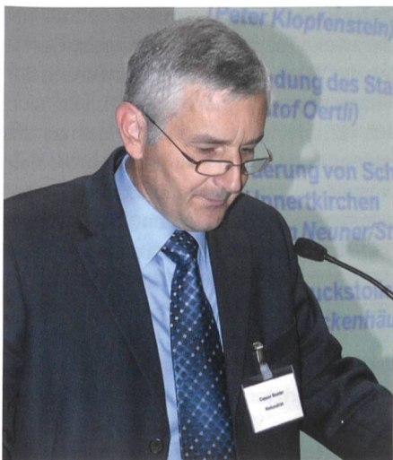
Bild 1. Nationalrat Caspar Baader, Präsident SWV.

Spätestens mit den in jüngster Zeit massiv angestiegenen Rohölpreisen ist die Frage der sicheren Energieversorgung ins Zentrum des öffentlichen Interesses gerückt. Nebst dem Rohölpreis ist aber auch die Politik massgeblich verantwortlich für diese Diskussion.