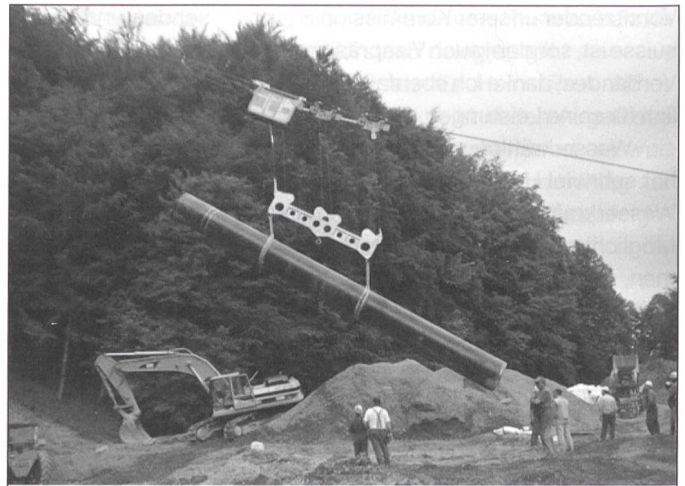
Transport und Versetzen Erdgasleitung, Rohrgewicht 12 Tonnen