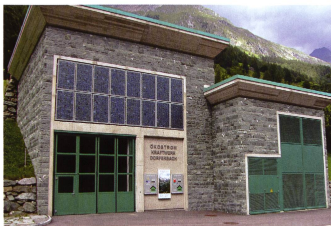
Bild 4. Krafthaus Dorferbach mit Photovoltaikanlage über dem Eingangstor.