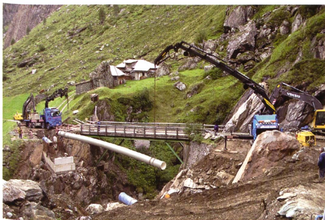
Bild 3. Montage einer 23 m langen Stahlrohrbrücke.

Im Juli 2007 zeigten sich bei einer planmässigen Kontrolle der Turbine überdurchschnittlich grosse Verschleisserscheinungen infolge Hydroabrasion an den 22 Laufradbechern. Eine Analyse der aufgezeichneten Geschiebeablagerungen in den Entsanderkammern zeigte, dass es bei einem Hochwasserereignis im Juni des Jahres zu grösseren Feststoffeinträgen in das Triebwassersystem gekommen sein musste. Dies war darauf zurückzuführen, dass während der Spülung einer der beiden Entsanderkammern die Spülautomatik der jeweils anderen Kammer blockiert