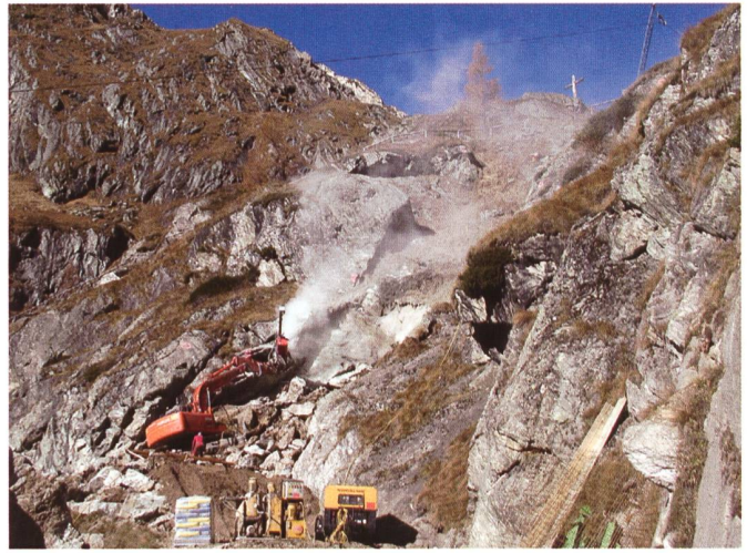
Bild 2. Sprengabtrag in einem Steilhang auf über 1900 m ü.M.

serführung im Sommerhalbjahr kommt es zudem zu beträchtlichem Überwasser. Im Winter wird zusätzlich ein Teil eines nahe gelegenen Seitenbaches ebenfalls mit einem kleinen Tiroler Wehr gefasst und in die Entsanderanlage beigeleitet, um in der Niederwasserperiode die Energieerzeugung zu erhöhen. Nach Einzug durch den Grobrechen (lichter Stababstand 138 mm) wird das Wasser-Feststoff-Gemisch in zwei 26 m langen Entsanderkammern bis zu einem Grenzkorndurchmesser von 0.3 mm entkiest und entsandet. Jede Kammer ist mit einem Entlastungsüberfall, einem Einlauf- und Spülschütz und drei Sohlmembranen versehen. Letztere registrieren die Geschiebeablagerung und lösen bei Erreichen eines voreingestellten Wertes den Spülvorgang aus. Das Wasser-Feststoff-Gemisch wird über einen knapp 50 m langen Spülkanal in den Dorferbach zurückgeleitet, die typische Spüldauer beträgt ca. 15 Min. Durch einen horizontalen Feinrechen gelangt das Triebwasser in eine Entnahmekammer und von dieser in die DRL.