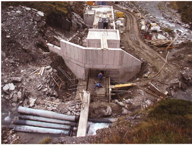
Bild 1. Bau der Wasserfassung (Vordergrund) und Entsanderanlage (Hintergrund) auf 2000 m ü.M.: Erkennbar sind Rohre für die Bachumleitung während der Errichtung des Tiroler Wehres.