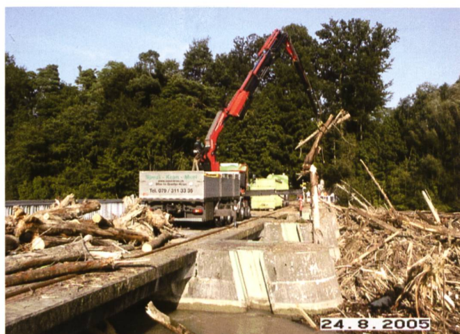
Bild 3. Aufräumarbeiten beim Kraftwerk Bremgarten-Zufikon nach dem Hochwasser vom August 2005.