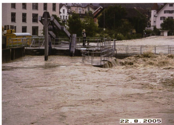
Bild 2. Das Kraftwerk Bruggmühle bei Bremgarten an der Reuss während dem Hochwasser vom August 2005.

Grundsätzlich sind die Wasserkraftwerke die am meisten hochwassergefährdeten Anlagen der Stromversorgung, da sie mitten in den Gewässern stehen. Andererseits sind sie gerade deswegen so ausgelegt, dass sie den Hochwassern standhalten. Es