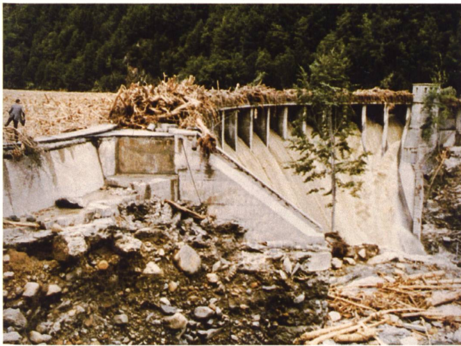
Bild 4. Verklauungen an der Hochwasserentlastungsanlage Palagnedra 1978.