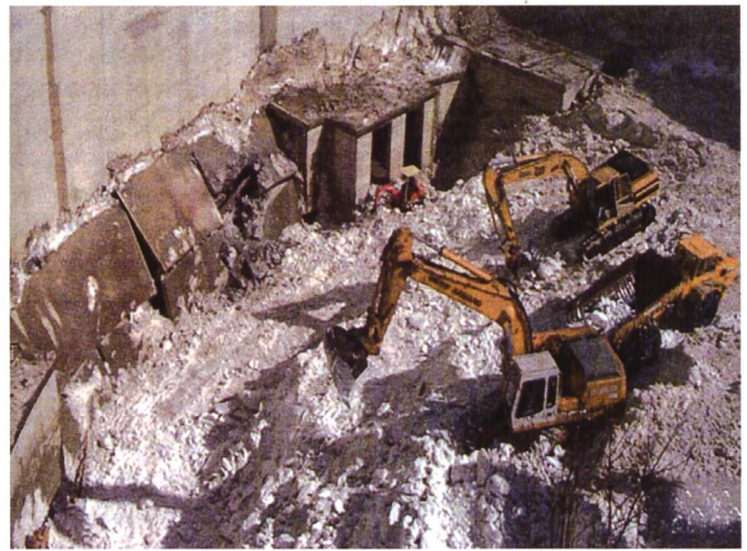
Bild 5. Aufräumarbeiten nach dem Lawinnenniedergang auf die Staumauer Ferden 1999.

ist deshalb festzustellen, dass die Schäden an Wasserkraftwerken nach Hochwasserdurchgängen trotz exponierter Lage relativ gering sind.