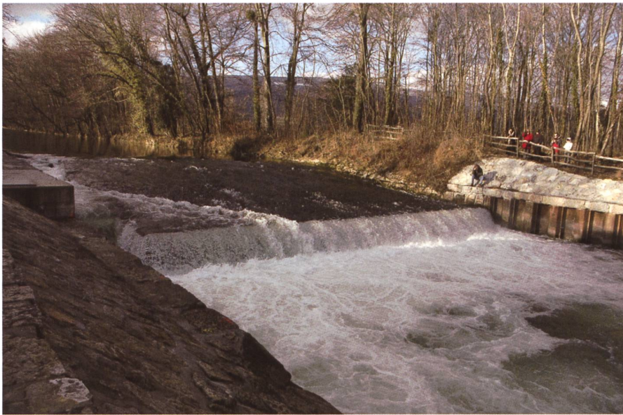
Bild 5. Künstliches Hindernis an der Areuse. In den Fließgewässern der Schweiz existieren zirka 88000 künstliche Hindernisse > 0.5 m (BAFU 2007). Diese verhindern eine rasche Wiederbesiedlung revitalisierter Flussabschnitte und sind bei der Planung von Flussrevitalisierungen einzubeziehen.

Bedeutung besitzen. An der Thur lassen sich viele Revitalisierungsziele mit der Nase ( Chondrostoma nasus ) als Flaggschiffart erklären. Die Nase ist ein anspruchsvoller Wanderfisch, der auf Strukturvielfalt, Dynamik und hindernisfreie Fließgewässer angewiesen ist. Zudem handelt es sich um eine Fischart, die in der Schweiz als «vom Aussterben bedroht» eingestuft ist. Weitere Flaggschiffarten für die Thur sind der Flussregenpfeifer ( Charadrius dubius ) oder die deutsche Tamariske ( Myricaria germanica ). Das Auftreten dieser beiden Arten ist eng mit dem Vorkommen von Kiesbänken verbunden.