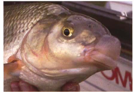
Bild 6. Nase ( Chondrostoma nasus ). Der Einbezug von Flaggschiffarten hilft, Revitalisierungsziele und angestrebte ökologische Verbesserungen einem breiten Publikum leicht verständlich zu erklären.

Ein ökonomisches Modell prognostiziert die Auswirkungen von Flussrevitalisierungen auf die lokale Wirtschaft. Für das an der Thur geplante Revitalisierungsprojekt bei Weinfeld-Bürglen wird