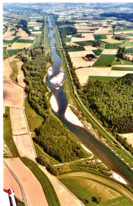
Bild 1. Thur beim Schaffäuli, Kt. TG/ZH, vor der Revitalisierung (links) und nach dem Bau der Aufweitung (rechts).