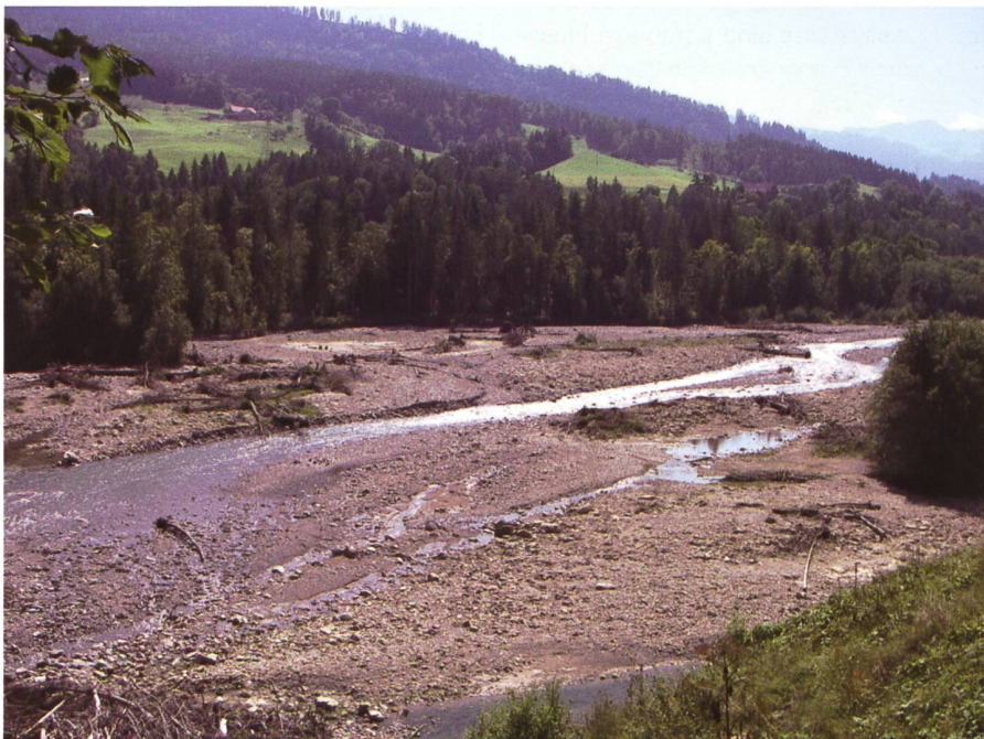
Bild 2. Sense bei Plaffeien. Der Oberlauf der Sense weist eine natürliche Morphologie und Hydrologie auf. Daher kann sie als Referenzgewässer für typenähnliche Flüsse verwendet werden.

Falls kein Baseline-Monitoring durchgeführt wurde, ist es immer noch