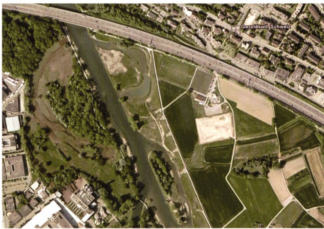
Bild 3. Flussaufweitung an der Limmat bei Geroldswil.

möglich, ein «post-treatment-design» zu verwenden. In diesem Fall werden revitalisierte Strecken mit ähnlichen, nicht revitalisierten Abschnitten innerhalb des Gewässers verglichen.