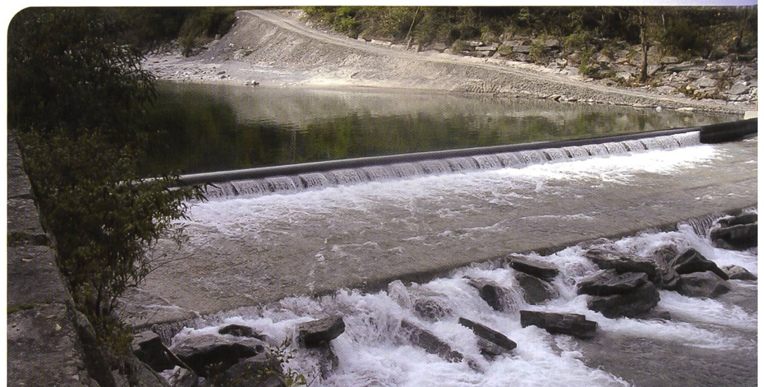
Wehranlage Ponte Brolla /Maggia

Abmessungen: H=0,95 x 43,0 m, luftgefüllt, Bj. 2008, inkl. komplette Wehrsteuerung für Schlauchwehr und Einlassschütz