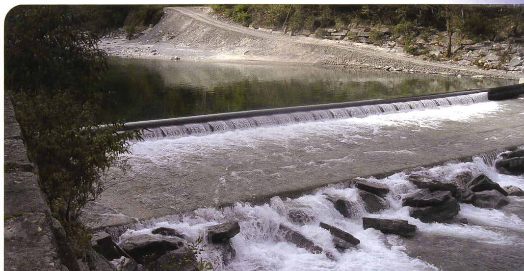
Wehranlage Ponte Brolla /Maggia

Abmessungen: H=0,95 x 43,0 m, luftgefüllt, Bj. 2008, inkl. komplette Wehrsteuerung für Schlauchwehr und Einlassschütz