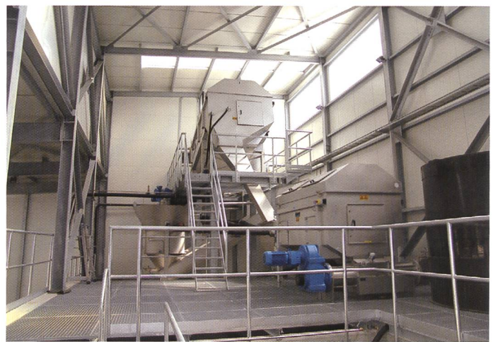
Bild 3. Die Prozesslinie der neuen Strassenschachtschlamm-Recycling-Anlage in Aarberg.