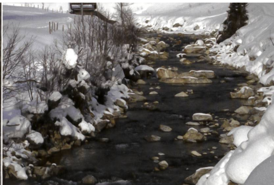
Bild 2b. Gadmerwasser im Winter 2010 mit einer geschätzten Dotierwassermenge von 150 l/s. Im oberen Bildrand ist das Wehr der Fassung Fuhren zu erkennen.