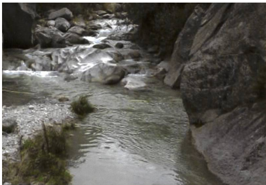
Bild 2a. Künftige Restwassersituation in der Aare unterhalb der Fassung Handeck (Dotierversuche Herbst 2008 mit einer Dotierwassermenge von rund 200 l/s).