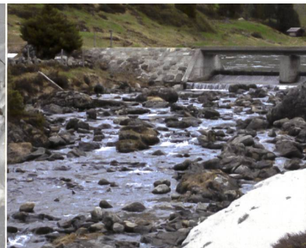
Bild 2c. Künftige Reaktivierung des Ausflusses aus dem Engstlensee.

auch Massnahmen zur Verbesserung des Geschiebehaltungs, der Durchgängigkeit und der Landschaft (Dotation Engstlenseeausfluss) umgesetzt werden. Zusätzlich wurden mit dem Fischereiverein Oberhasli weitere Massnahmen zur Förderung der heimischen Fischfauna hinsichtlich Verdriftung in das Kraftwerkssystem und bezüglich potenziellen Aufwertungsmassnahmen von zwei kleinen Aufzuchtgewässern vereinbart. Während in Tabelle 2 alle Massnahmen kurz beschrieben sind, zeigt Bild 1 die geographische Verteilung der Massnahmen und die Fotos ( Bild 2a, 2b, 2c ) zeigen die künftige Situation in den zwei Hauptgewässern des Oberhasli und die Reaktivierung des Ausflusses aus dem Engstlensee.