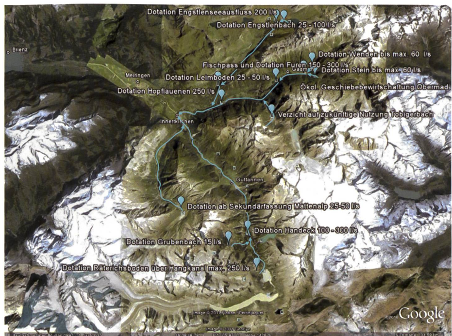
Bild 1. Die gewässerökologischen Massnahmen im Rahmen der KWO-Gewässersanierung. Die blauen Pfeile geben die Restwasserstrecken mit Dotierungen an.

Ausserdem wurde im Gremium beschlossen, dass im Rahmen der Gewässersanierung neben Restwasserdotierungen