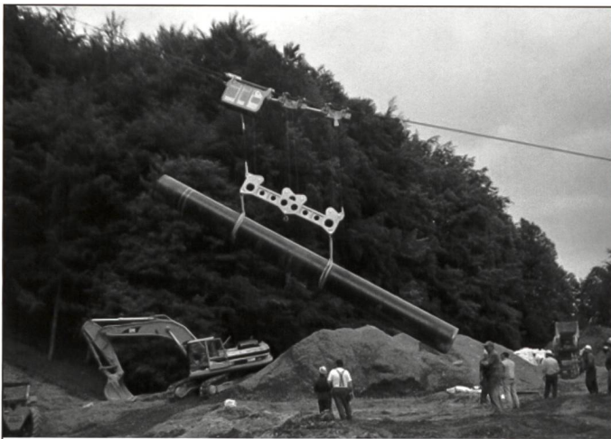
Transport und Versetzen Erdgasleitung, Rohrgewicht 12 Tonnen