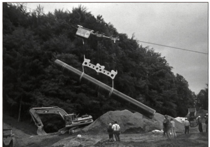
Transport und Versetzen Erdgasleitung, Rohrgewicht 12 Tonnen