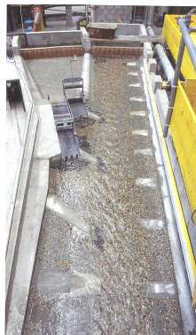
Bild 1. Physikalisches Modell der Einleitung des geplanten Beruhigungsbeckens der Kraftwerke Oberhasli AG in die Hasliaare. Oben links ist ein Teil des Beruhigungsbeckens und oben rechts das Ende der Restwasserstrecke zu sehen. Die Fliessrichtung ist auf diesem Bild von oben nach unten.

Mit Schwallversuchen kann der Abfluss in der Schwallstrecke durch eine Anpassung der eingeleiteten Wassermenge so variiert werden, dass Schwallereignisse mit unterschiedlicher Ausprägung (Schwall/Sunk-Verhältnis, Abflussänderungsrate, maximaler und minimaler Abfluss usw.) nachgebildet werden können (Limnex 2006; Limnex 2009; Schweizer et al. 2010). Damit können die Auswirkungen von Sanierungsmassnahmen auf die Hydrologie der Schwallstrecke simuliert und kurzfristige Auswirkungen auf die Gewässerökologie unter zukünftigen (z.B. sanierten) Abflussbedingungen untersucht werden. Schwallversuche bieten dementsprechend Erkenntnisse unter sehr realitätsnahen Bedingungen (lokale Organismen, Grössenordnungen der Prozesse, usw.). Längerfristige Auswirkungen (z.B. Veränderung der Biomasse oder Artenvielfalt) können zwar aus Schwallversuchen mit fundierten Kenntnissen der Gewässeröko-