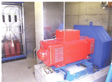
Bild 3. Turbinenanlage.

misch und ökologisch sinnvoll. Einerseits soll sie der Gemeinde Molinis helfen die hohen Investitionen von CHF 2.96 Mio. über den Stromverkauf zu amortisieren, andererseits entspricht die Produktion immerhin dem Energieinhalt von 120 Kubikmetern Heizöl mit einem CO 2 -Ausstoss von rund 370 Tonnen pro Jahr.