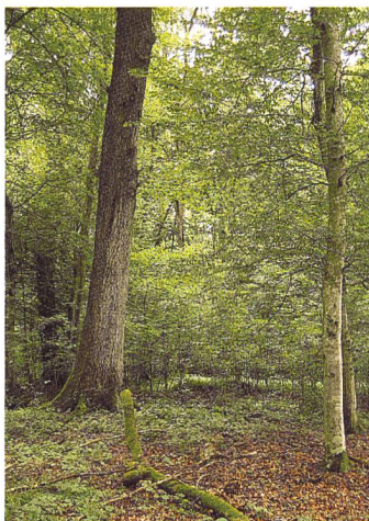
Bild 4. Zielarten wie die Eichen-Stabflechte ( Bactrospora dryina ) sind auf einen intakten Auen-Lebensraumverbund angewiesen.