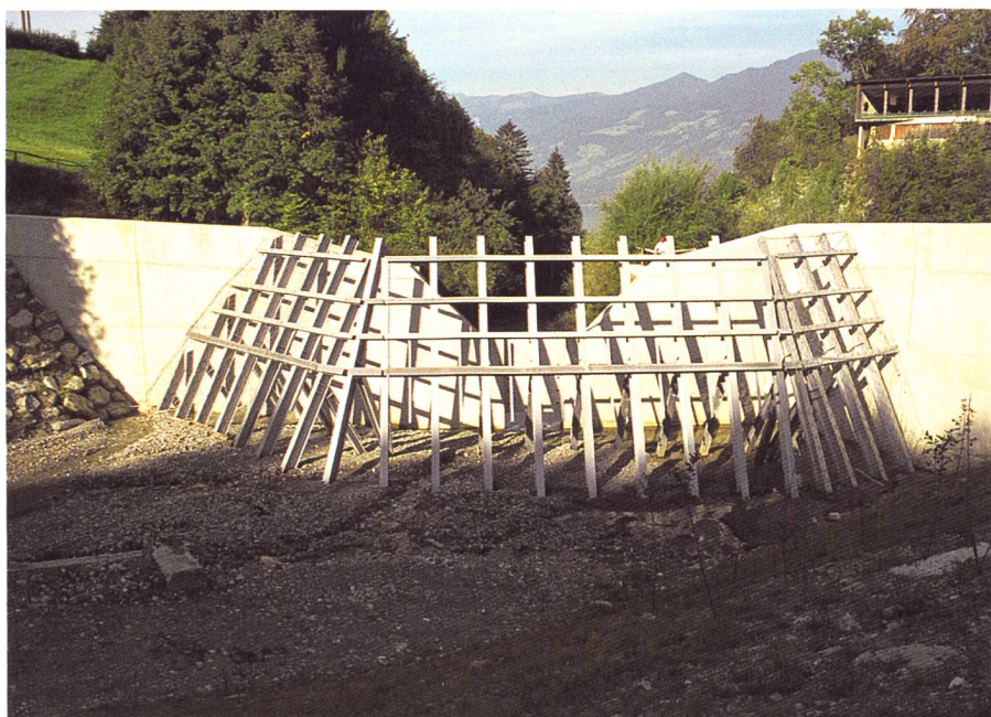
Bild 3. Geschiebesammler am Dorfbach von Sachseln mit Grobrechen zum Schutz vor Geschwemmsel. Die kleine Durchlassöffnung staut den Sammler schnell ein, sodass die Geschiebedurchgängigkeit bereits bei kleineren Hochwasser nicht mehr gewährleistet ist (Photo Dr. Martin Jäggi).

Die Gewässersohle ist ein wichtiger Lebensraum für verschiedene Pflanzen und Tierarten. Es ist bekannt, dass menschliche Eingriffe wesentliche Auswirkungen auf die Struktur der Gewässersohle haben. Hierzu zählen unter anderem die Kolmatierung oder Eintiefung der Gewässersohle durch verminderte Geschiebedynamik oder durch Geschiebeentnahme. Die Auswirkungen dieser Eingriffe auf das Zoobenthos der Gewässersohle ist in verschiedenen Studien untersucht worden. Weitgehend unbekannt ist allerdings, wie sich Sanierungsmassnahmen in Form von Geschiebezugaben oder -mobilisierungen auf das Zoobenthos auswirken. Darüber hinaus ist von Interesse, ob Änderungen in der Zusammensetzung des Zoobenthos im Zuge von Geschiebesanierungen als Indikator zur Erfolgskontrolle oder für Monitoringprogramme herangezogen werden können. In diesem Zusammenhang ergeben sich folgende Fragen: Wie wirkt sich eine Geschiebezugabe sowie eine räumlich und zeitlich veränderte Geschiebedynamik auf die Verteilung und Zusammensetzung der Zoobenthosgemeinschaften aus? Zeigen die Gemeinschaften ein allgemeines Verhalten in Bezug auf eine geänderte Geschiebedynamik und/oder infolge von Geschiebezugaben? Können Veränderungen der Zoobenthosgemeinschaften herangezogen werden, um aussagekräftige und praxistaugliche Indikatoren zu definieren für eine Bewertung des Ist-Zustands, zur Prognose der Auswirkungen von Geschiebezugaben und -dynamisierungen sowie für eine Erfolgskontrolle?