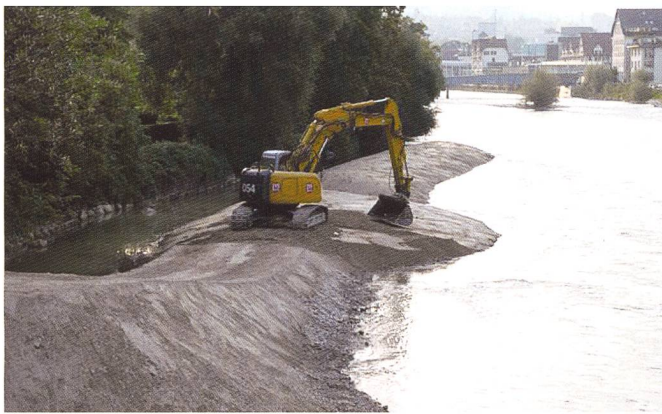
Bild 2. Kiesschüttung Breitensteinstrasse in der Limmat. Blick gegen die Fliessrichtung.

durchgeführt, um die im Labor gemessenen Erosionsraten zu reproduzieren. Die Arbeit vertieft das Grundlagenwissen zum Prozess der Seitenerosion und dessen Parametrisierung für die Prognose mittels numerischer Simulation. Zusätzlich soll für die Praxis aufgezeigt werden, wie Einbauten bzw. Kiesschüttungen optimal ausgeführt werden können (z.B. Ort und Art der Zugabe, Häufigkeit der Erneuerungen), damit sie effizient Seitenerosionsprozesse auslösen und gleichzeitig als Geschiebedepot dienen.