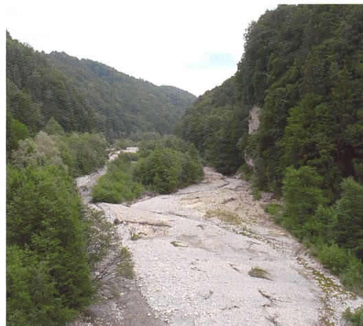
Bild 5. Geschiebe- und Lebensraumdynamik machen Auenlandschaften zu den artenreichsten Ökosystemen der Schweiz.

sierungsprojekte vergleichen. Schliesslich lassen sich die Spezifikationen eines begleitenden, langfristigen Monitorings zur Entwicklung der auentypischen Biodiversität erstellen.