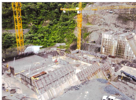
Bild 3. Toachi, Ecuador.

Auch wenn die technischen Probleme unter vielen Aspekten die gleichen sind wie vor 30 oder 40 Jahren, hat sich das Umfeld für die Ingenieurleistungen hingegen somit drastisch geändert. Dank des ausgezeichneten Niveaus der Schweizer Hochschulen verfügen die hier ausgebildeten Ingenieure auch im Wasserbau nach wie vor über eine ausgezeichnete Grundausbildung. Der Zugang zum internationalen Markt des konstruktiven Wasserbaus ist damit jedoch nur bedingt möglich, weil die Präsenz der Schweizer Ingenieurbüros