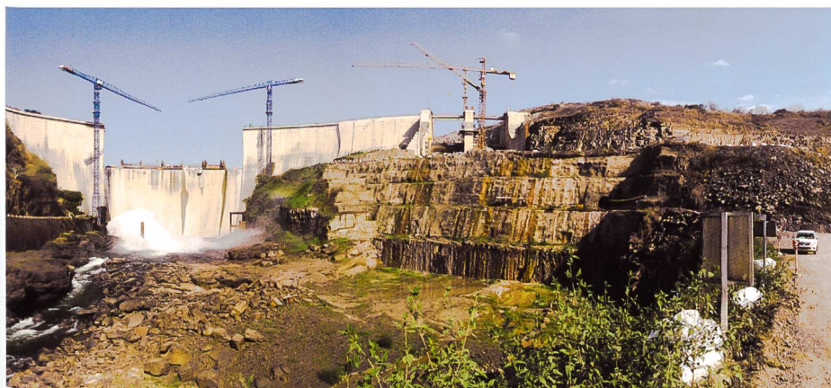
Bild 5. Cambambe, Angola.