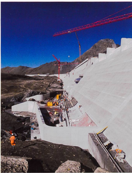
Bild 6. Muttsee, Schweiz.