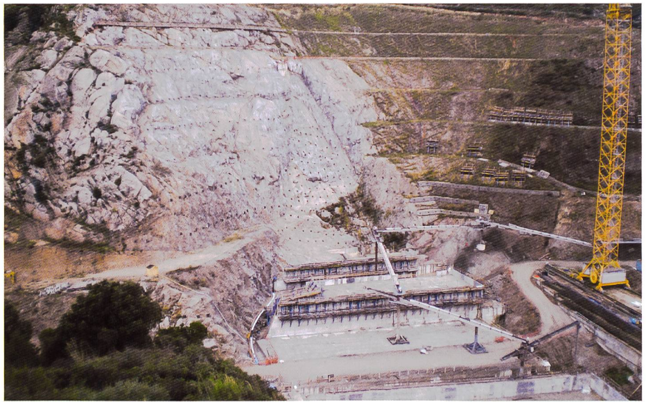
Bild 7. Cumbidanovu, Italien.

in den letzten Jahrzehnten trotz allgemein blühenden Investitionen immer weiter geschrumpft ist. Es hat somit nicht an technischer Kapazität gemangelt, sondern vielmehr an organisatorischer Weitsicht. Ausgezeichnete Wasserbauingenieure haben leider die organisatorische Wende im Wesentlichen versäumt, auch weil sogar innerhalb der Schweiz meistens der Konkurrenzkampf und nicht der Zusammengang Priorität hatte.