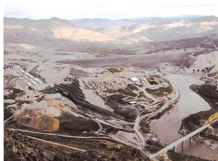
Bild 4. Anlage Illisu, Türkei.