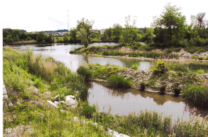
Bild 5. Stutzacher nach der Fertigstellung des neuen Seitenarms.