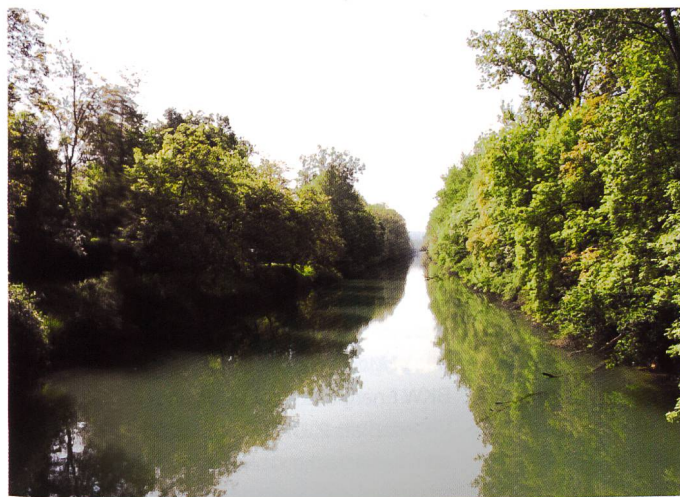
Bild 6. Kallnachkanal vor der Realisierung des Revitalisierungsprojekts.