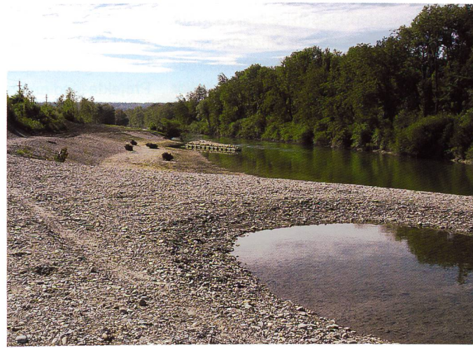
Bild 7. Neu geschaffene Flachwasserzonen und Amphibienteich im Kallnachkanal.