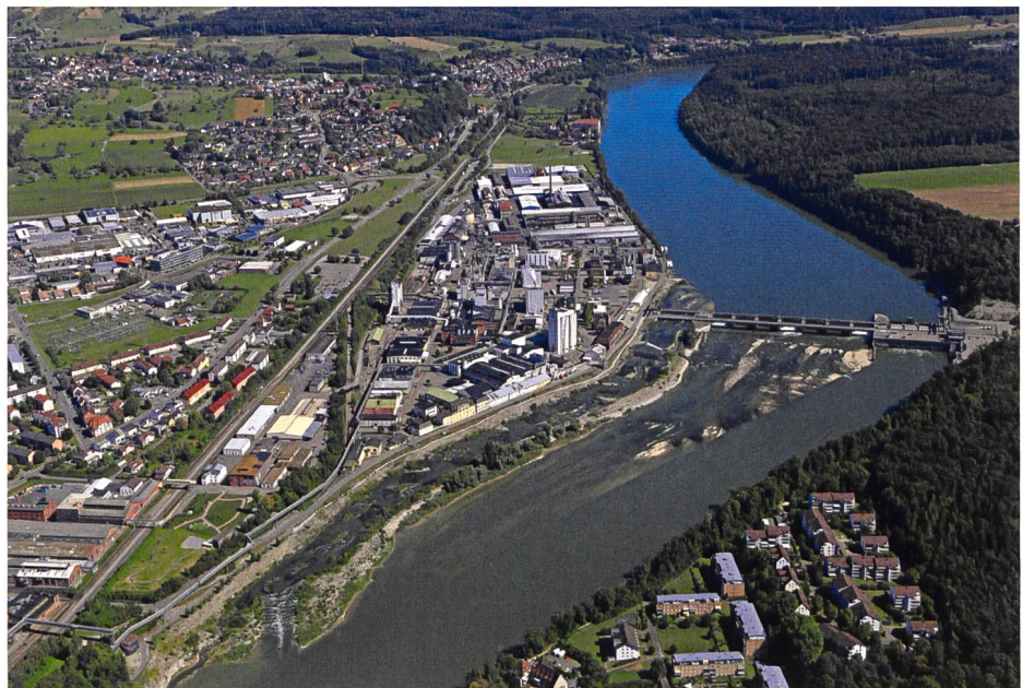
Bild 2b. Kraftwerk Rheinfelden mit Umgehungsgewässer (links) und Vertical-Slot-Fischpass (rechte Uferseite); Foto: Energiedienst.

Angebot an (mehrtägigen) Aus- und Weiterbildungskursen.