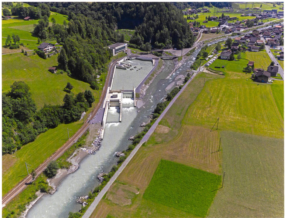
Bild 2a. Ausgleichsbecken Kraftwerke Oberhasli (KWO); Foto: Markus Zeh, Bremgarten.

Die Vermittlung des spezifischen Wissens für die Sanierung Wasserkraft erfolgt primär im Rahmen von Anlässen zum Erfahrungsaustausch und mittels Publikationen. Für die Bereiche Schwall und Sunk wie auch für die Fischgängigkeit sind die von der Wasser-Agenda 21 durchgeführten Erfahrungsaustausche etabliert. Demgegenüber fanden für den Bereich Geschiebe noch kaum Austausche statt. Vereinzelt wird Wissen auch von Verbänden weitergegeben. Lücken sehen die betroffenen Akteure v.a. beim Austausch von internationalem und interdisziplinärem Wissen, z. B. aus Deutschland, und beim