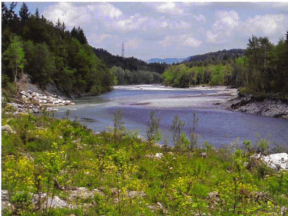
Bild 2. Eigendynamische Aufweitung am Beispiel der Kander Augand, 2006.

Der Fokus dieser Arbeit liegt auf Aussagen zur Hochwassersicherheit in Flüssen mit Geschiebetransport und lateraler Entlastung. Als Ausgangslage für dieses Projekt dient das «Positionspapier zu seitlichen Hochwasserentlastungen an Flüssen» der KOHS. Der Einfluss der Sohlenmorphologie wird in heute gängigen Bemessungskonzepten bzw. bei deren Umsetzung mittels numerischer Modelle in der Regel weitgehend nicht berücksichtigt, oder er wird nur sehr rudimentär abgebildet. Besonders die instationären Prozesse während des Durchgangs einer Hochwasserganglinie werden noch nicht