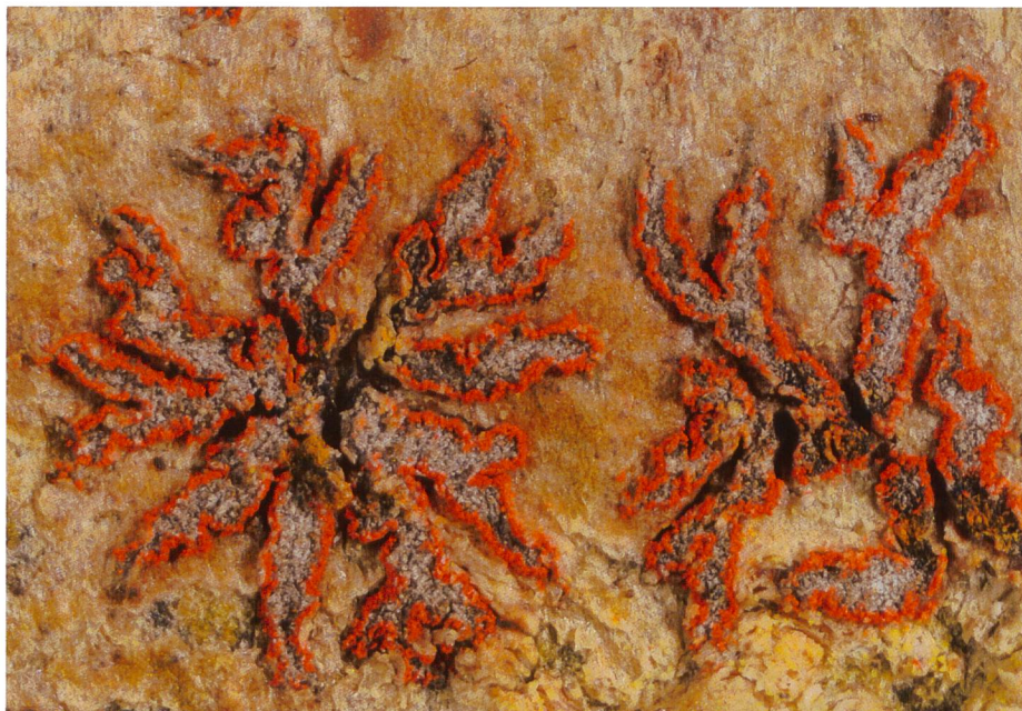
Bild 6. Die Zinnoberrote Fleckflechte ( Arthonia cinnabarina ) ist auf junge Eschen in Hartholzauenwäldern angewiesen.

abnimmt. Populationsgenetische Daten können so auch zur Beschreibung der Habitatvernetzung eingesetzt werden.