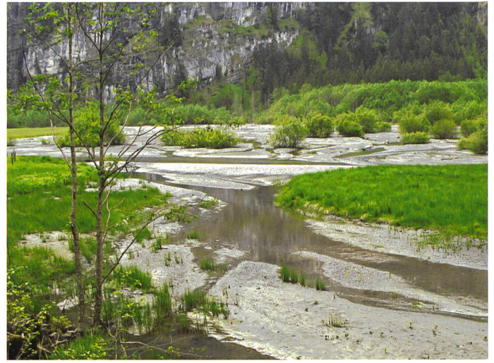
Bild 4. Naturnahe Fließgewässer sind eng vernetzt mit ihrem Umland.