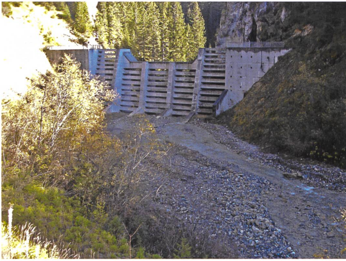
Bild 3. Geschiebesammler sollen so ausgestaltet werden, dass sie bei kleineren Abflüssen geschiebendurchgängig sind, wie etwa hier in Nant Rouge (Foto: Sebastian Schwindt).