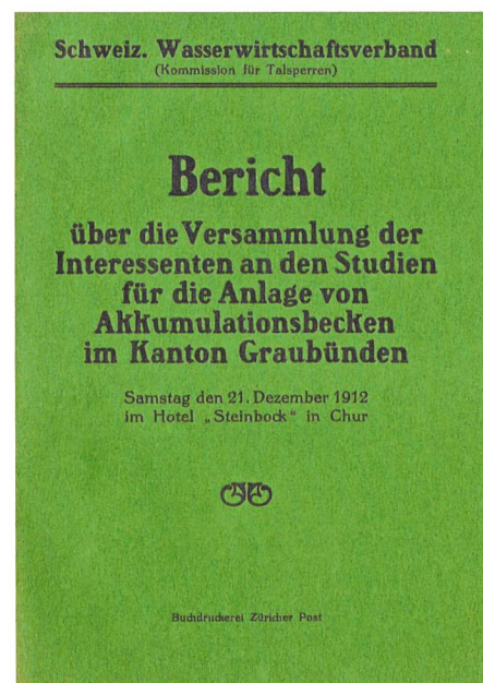
Bild 1. Bericht zur Versammlung am 21. Dezember 1912 als eigentlichem Startschuss zur Gründung.

Als erster Verbandspräsident wurde der Bündner Nationalrat Josef Dedual gewählt, der anschliessend während 22 Jahren die Geschicke des Verbandes leitete. Auch die weiteren an der Versammlung gewählten Vorstandsmitglieder waren durchwegs