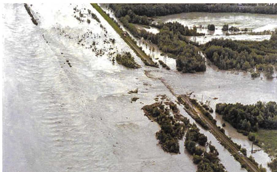
Bild 3. Dammbreach am unteren Alpenrhein bei Fussach während des Hochwasserereignisses 1987 (Quelle: Archivbild St. Galler Tagblatt).

Mit dem zweiten Hauptanliegen, den Wildbachverbauungen und Geschiebesammlern in den Erosionsgebieten, zielte man auf die Verminderung des Geschiebeaufkommens und der Aufschotterung des Rheins, welche im Rheintal immer wieder zu verheerenden Hochwasserereignissen beigetragen hatte, so unter anderem 1910 und 1927 sowie in neuerer Zeit auch 1954, 1987, 1999 und 2005 (Bild 3).