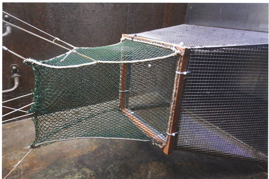
Bild 1: Kombinierte Kehle aus Metall- und Netztrichter. Die Netzkehle wird mit Schnüren nach vorne aufgespannt, sodass sich eine schmale aber flexible Öffnung bildet.

methode mit festgelegten Bewertungskriterien (Woschitz et al., 2020). Reusen gelten als klassische Methode für Fisch-