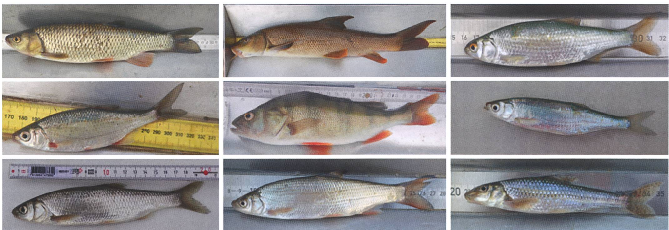
Bild 4: Im Zählbecken Winznau gefangene Fische. Abgebildet sind die neun häufigsten Arten (von oben links: Alet, Barbe, Rotauge, Schneider, Egli, Laube, Hasel, Nase, Gründling).