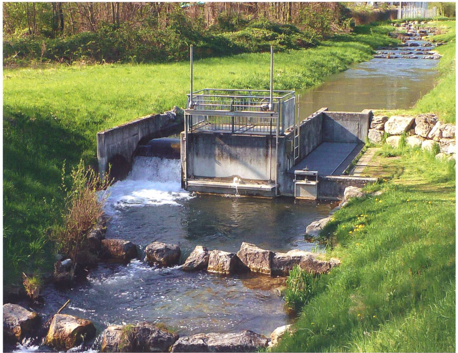
Bild 2: Zählbecken Winznau im Betriebszustand. Bei geschlossenem Schütz (Mitte) strömt das Wasser über den Überfall (links) und durch das Zählbecken (rechts).

Nachdem die Effizienz der neuen Kehle bestätigt worden war (Wilmsmeier et al., 2020a), wurde damit am Wehr Winznau die schweizweit erste Zählung mit der Kehle über ein ganzes Jahr durchgeführt. Deren Resultate sind von grosser Bedeutung für eine zukünftige Festlegung eines Bewertungsschemas von Fischaufstiegsanlagen mittels Fischzählungen. Bei der Zählung sollten neben dem tatsächlichen Fischaufstieg auch weitere Erfahrungen im Zusammenhang mit der Fischzählung mit Zählbecken gesammelt werden. Offene Fragen zu einer möglichen Selektivität durch einen Scheueffekt am Einstieg des Zählbeckens und verletzten Fischen wurden mit Befischungen des Unterwassers und Videoaufnahmen in der Fischaufstiegsanlage weitergehend betrachtet: Bei den Zählungen von 2018 war aufgefallen, dass bestimmte