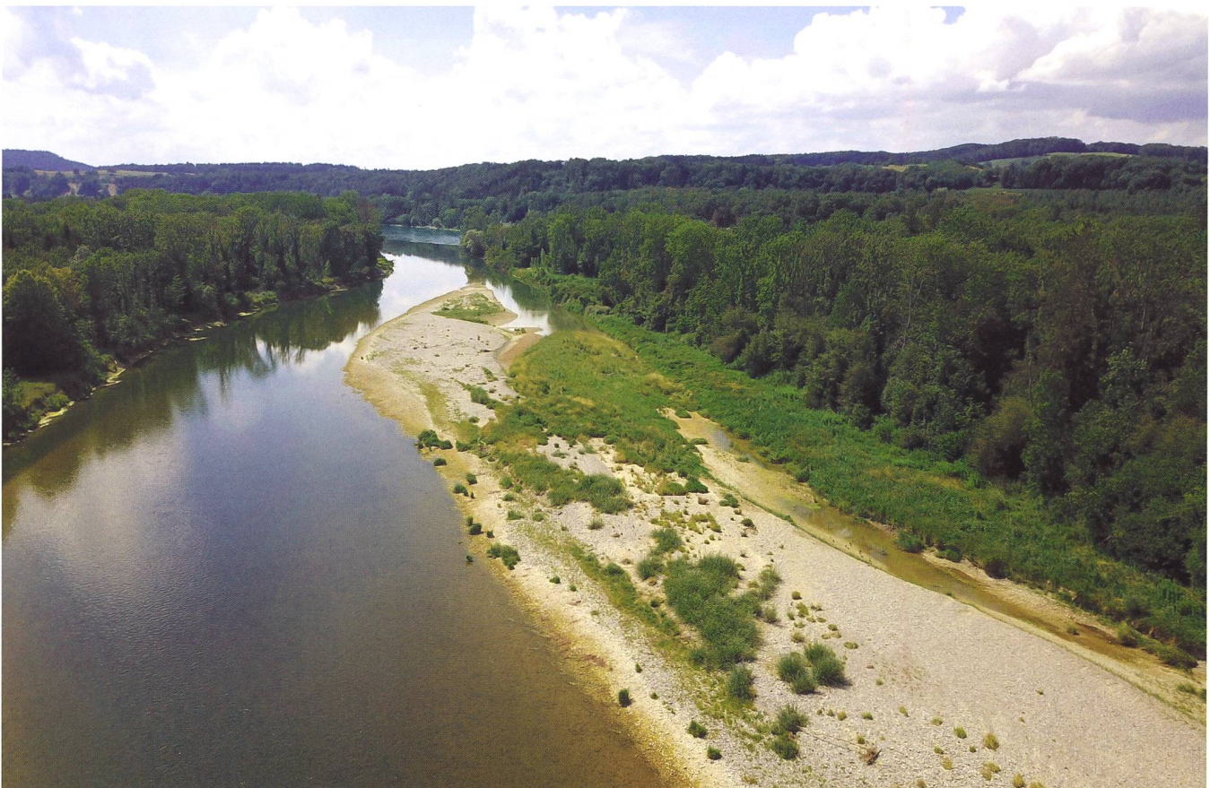
Bild 1: Die Baumaschinen sind abgezogen, die Thur kann die Gestaltung der Aue übernehmen: die revitalisierte Mündung der Thur in den Rhein.

Da, wo Wasser mit seiner ganzen Kraft wirken, sich vordrängen und wieder zurückziehen, Geschiebe transportieren und andernorts wieder ablagern kann, entstehen Auen. Am Übergang zwischen Wasser und Land gibt es so viele Strukturen und Lebensräume in unterschiedlichen Entwicklungsstadien, dass Auen zu den artenreichsten Gebieten überhaupt gehören. Sie bilden zusammen mit dem übrigen Gewässernetz einen wichtigen Teil der ökologischen Infrastruktur. In der Schweiz, wo Auen von nationaler Bedeutung nur noch rund 0,7 Prozent der Landesfläche ausmachen, ist der Druck auf diese Lebensräume sehr gross. Seit 1850 hat sich