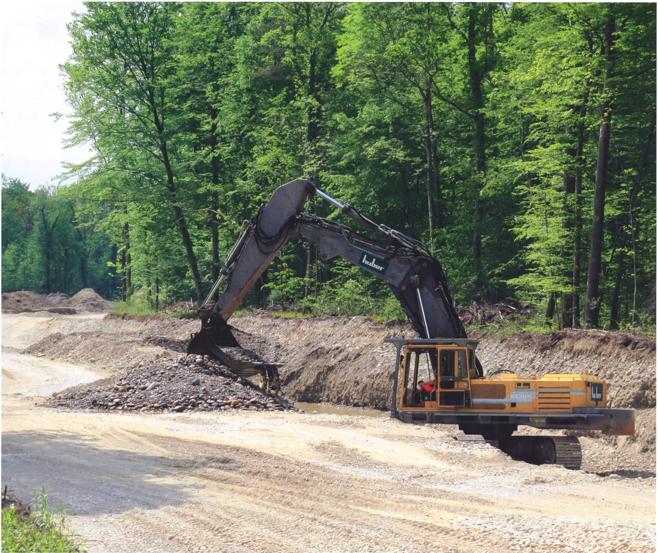
Bild 4: Um Auedynamik wiederzuerlangen, sind oft grosse bauliche Eingriffe notwendig. Schaffung eines dynamischen Seitenarms in der Aue Aarau-Wildegg.

gefährdet, vom Aussterben bedroht oder ausgestorben.