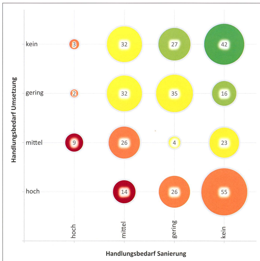
Bild 2: Gesamt-Handlungsbedarf für die Auen von nationaler Bedeutung als Kombination des Handlungsbedarfs für ökologische Sanierung und juristisch-planerische Umsetzung (Anzahl Objekte pro Kategorie): dunkelgrün: kein, hellgrün: geringer, gelb: mittlerer, orange: hoher, rot: sehr hoher Handlungsbedarf. Die Fläche der Kreise ist proportional zur Anzahl Objekte in der betreffenden Kategorie.

Bei der Ermittlung des Handlungsbedarfs pro Auengebiet hat das BAFU den Fokus auf zwei Parameter gelegt: den ökologischen Zustand und den Stand der juristischen und planerischen Umsetzung. Auen mit grosser ökologischer Bedeutung, deren Umsetzungsstand und/oder ökologischer Zustand noch ungenügend ist,