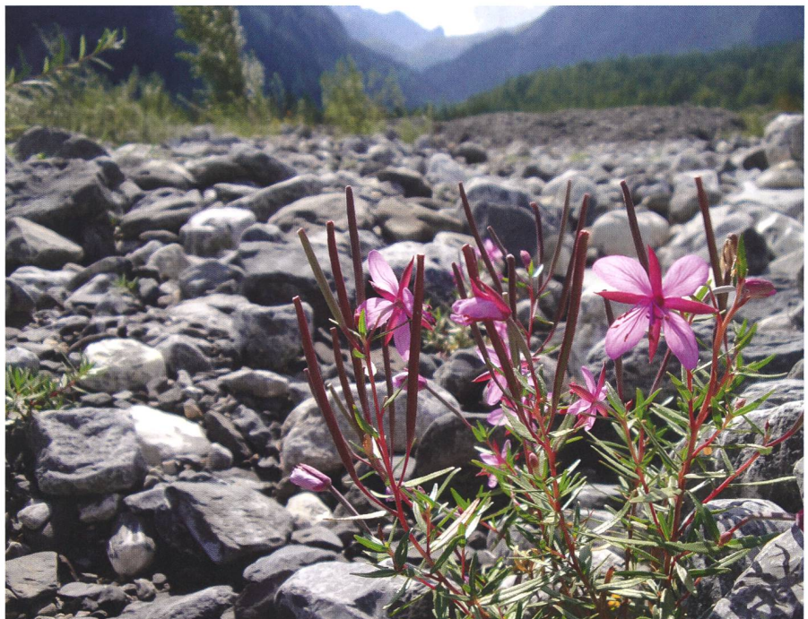
Bild 6: Die Gewässer brauchen Raum, um Ökosystemleistungen erbringen zu können. Wo genug Platz ist, entfaltet sich einzigartiges Leben. Fleischers Weidenröschen in der Derborence, einem Auengebiet von nationaler Bedeutung.

Wie gross der Gewässerraum sein sollte, hängt von Art und Grösse des Gewässers ab. Bei grösseren Gewässern, an denen sich die meisten Auen befinden, muss die Breite des Gewässerraums einzelfallweise bestimmt werden, wobei es auch gesetzliche Mindestvorgaben gibt,