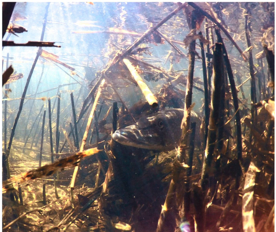
Bild 3: Durch ein Aufwertungsprojekt in der kleinen Aue Jägglioglunte am Brienersee wurde die Wasserzuleitung und die Verbindung mit dem See verbessert, so dass die Hechte wieder im Gebiet laichen können. Mehrere Partner waren am Projekt beteiligt, auch die Kraftwerke Oberhasli.

Auengebiete haben durch ihre Fülle an Arten und Lebensräumen eine grosse Bedeutung für die Biodiversität. Unter anderem auch aufgrund von ökologischen Defiziten der Gewässer ist diese in der Schweiz stark unter Druck. Etwa 18 Prozent der unmittelbar auf Gewässer angewiesenen Arten sind vom Aussterben bedroht, 4 Prozent sind bereits ausgestorben ( Bundesamt für Umwelt, 2011 ). Bei den Fischen sind beispielsweise 62 Prozent der Arten