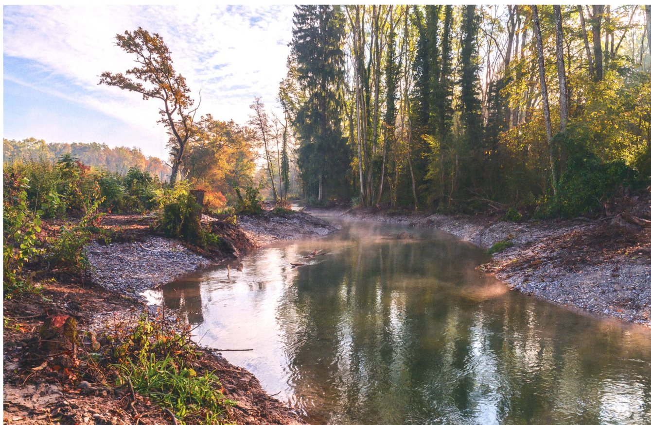
Bild 5: Das Projekt «Hochwasserschutz und Revitalisierung Alte Aare» gilt als Vorzeigebispiel für modernen Hochwasserschutz, bei dem der Schutz vor Überschwemmung nicht auf Kosten der Natur geht. Vielmehr ist es gelungen, die landschaftliche und ökologische Vielfalt stark zu erhöhen.

«Der Begriff «Park» ist eigentlich etwas irreführend. Es sind rund zwei Dutzend Flussabschnitte, in denen noch Rest-Auen vor-